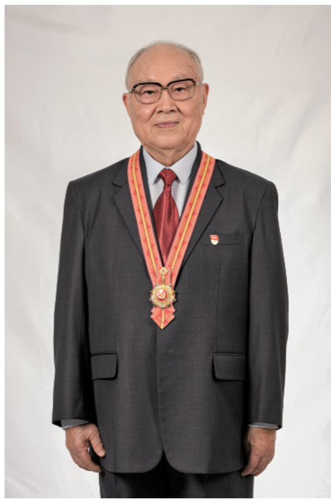
这是吕其明肖像（六月二十八日摄）。