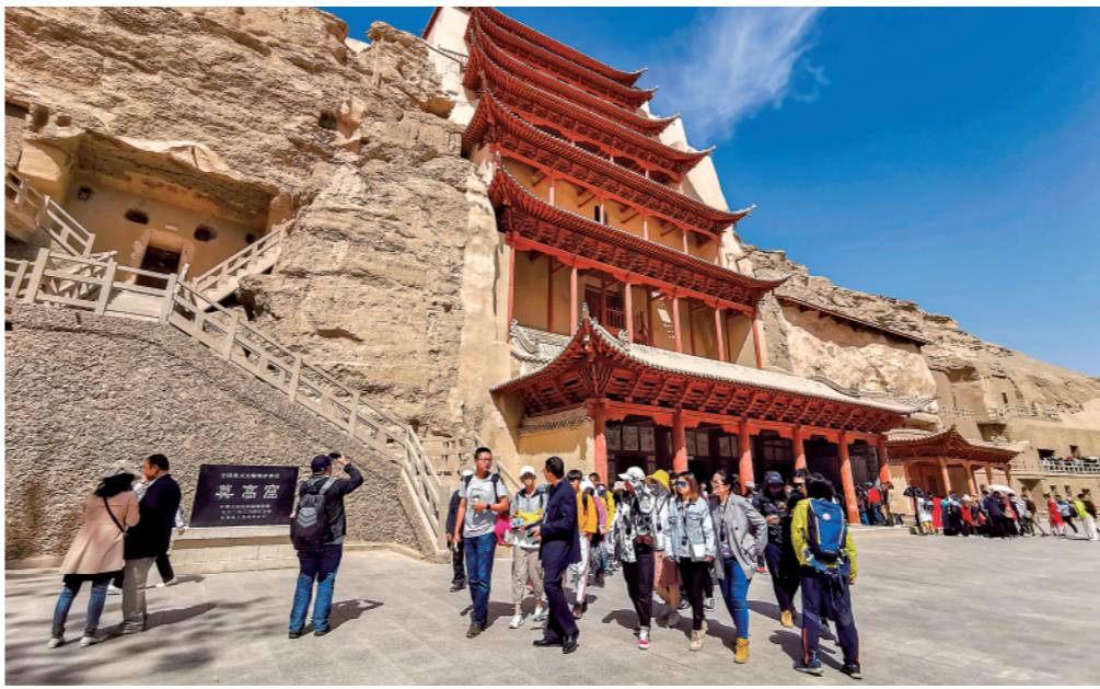
游客在敦煌莫高窟参观游览(2019年5月1日摄)。

景略、张忠培致信习近平总书记,希望促成良渚遗址早日申报世界文化遗产。习近平总书记对此作出重要指示:“要加强古代遗