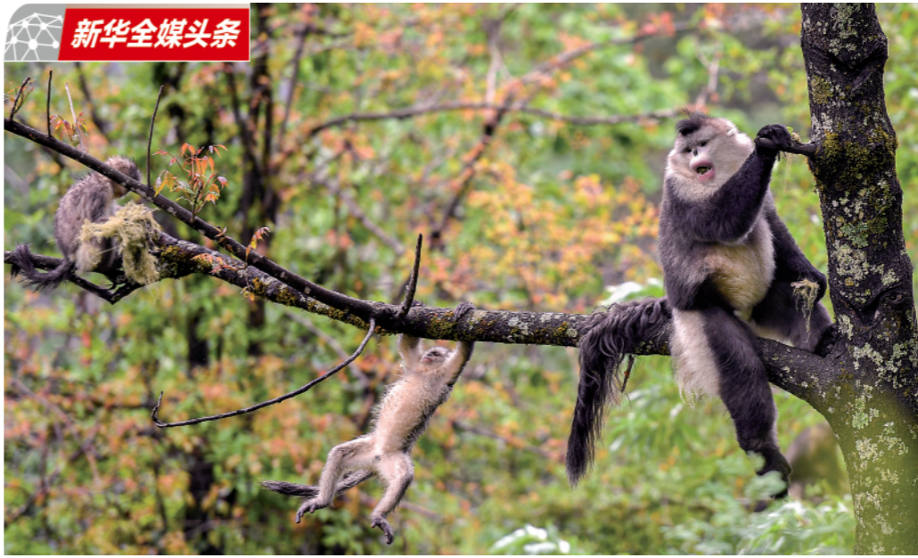
2020年5月23日在云南香格里拉滇金丝猴国家公园里拍摄的滇金丝猴。

极危、濒危、易危状况的受威胁物种932种。科研人员评估发现,我国已知高等植物35784种,其中受威胁物种有3879种。