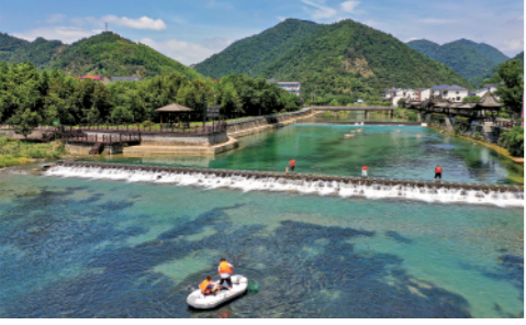
近年来,杭州市临安区积极推进“五水共治”,定期开展护河巡河活动,带领群众一起建设“幸福河湖”。