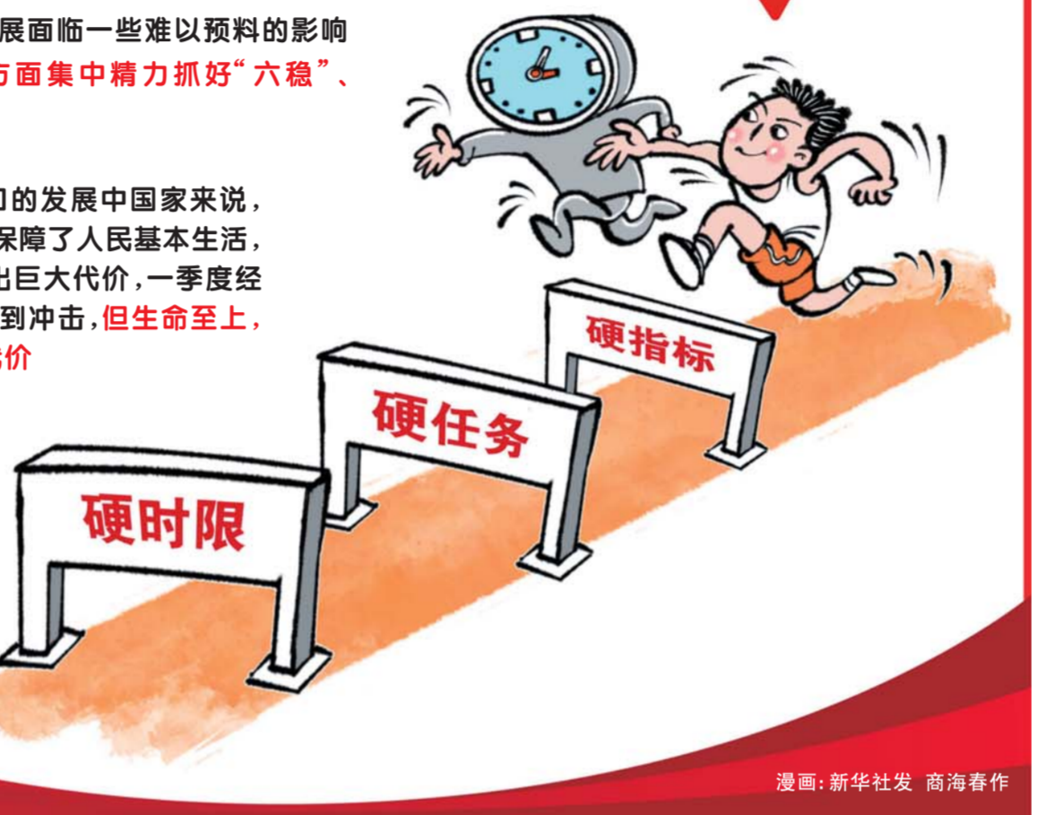
漫画：新华社 高海春作

业。开展消费扶贫行动，支持扶贫产业恢复发展。加强就业扶贫搬迁后续扶持，深化东西部扶贫协作和中央单位定点扶贫。强化兜底保障，搞好脱贫攻坚普查。接续推进脱贫与乡村振兴有效衔接，全力让脱贫群众迈向富裕。