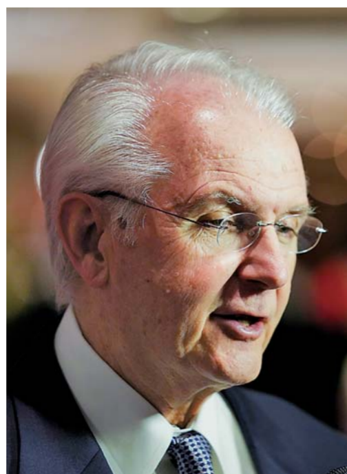
▲1月8日，美国中国总商会年度庆典活动前，美国密苏里州前州长、美国中部美中协会会长鲍勃·霍尔登接受采访。

新华社纽约1月8日电（记者刘亚南、王文）中美两国工商界人士8日晚在纽约出席美国中国总商会年度庆典活动时表示，中美两国经贸往来密切，期待两国经贸关系改善带来更多机遇。