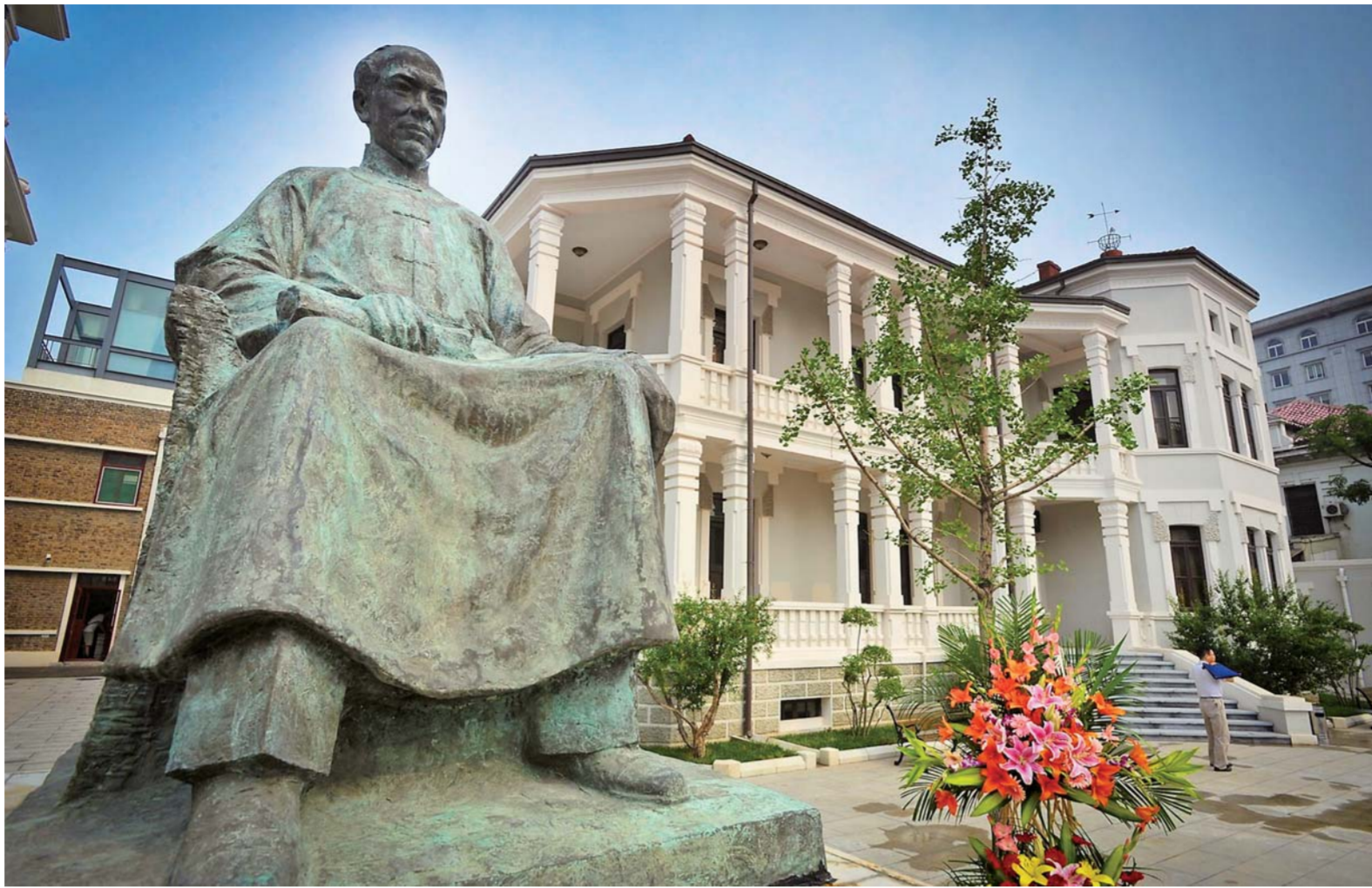
▲梁启超纪念馆内的梁启超雕像及故居。

隔窗相望,垂柳依依,小船悠悠,游人如织。同里,小桥流水人家。面对眼前这番热闹景致,突然有种说不出的感觉,年复一年,日复一日,这对水乡古镇来说,福兮?祸兮?或许,“痛并快乐着”吧!