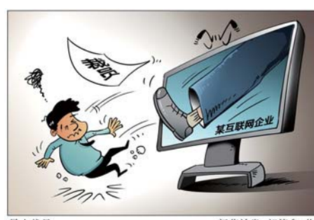
暴力裁员 新华社发 郭德鑫 作

看似简单的这一离职个案引发社会关注,因为事情发生在一家知名的网络公司,以往的舆论热点大多关注名企名人明星如何如何,如今这一热点聚焦于困难群众,可以说是