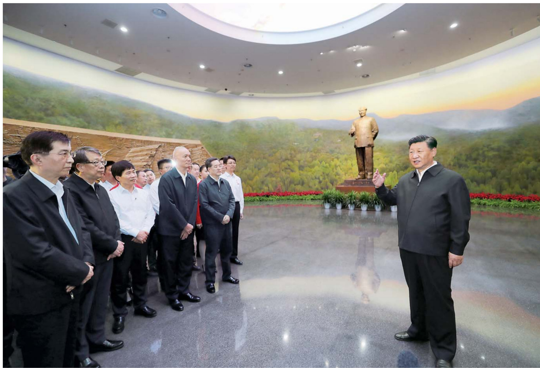
▲9月12日,中共中央总书记、国家主席、中央军委主席习近平视察中共中央北京香山革命纪念地。这是习近平在香山革命纪念馆参观《为新中国奠基》主题展览,并发表重要讲话。

■我们缅怀这段历史,就是要继承和发扬老一辈革命家“宜将剩勇追穷寇,不可沽名学霸王”的革命到底精神,不断增强中国特色社会主义的道路自信、理论自信、制度自信、文化自信,勇于进行具有许多新的历史特点的伟大斗争,坚决战胜前进道路上的各种艰难险阻,使“中国号”这艘巨轮继续破浪前进、扬帆远航