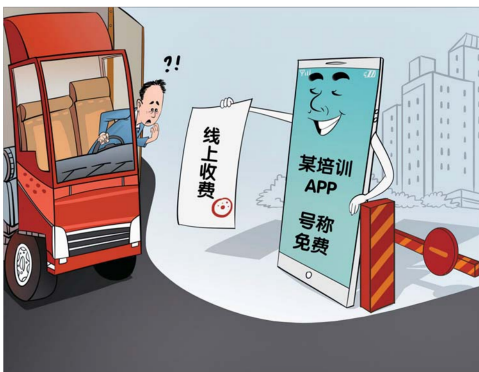
表里不一 新华社发 曹一作

督查组核查发现,“安途帮”运行8个多月来,济宁市、梁山县两级交通运输局并未对运行情况做评估评价,完全背离了通知中所称的“定期检查和通报平台安全教育培训使用情况”“评估通过平台教育培训效果”。