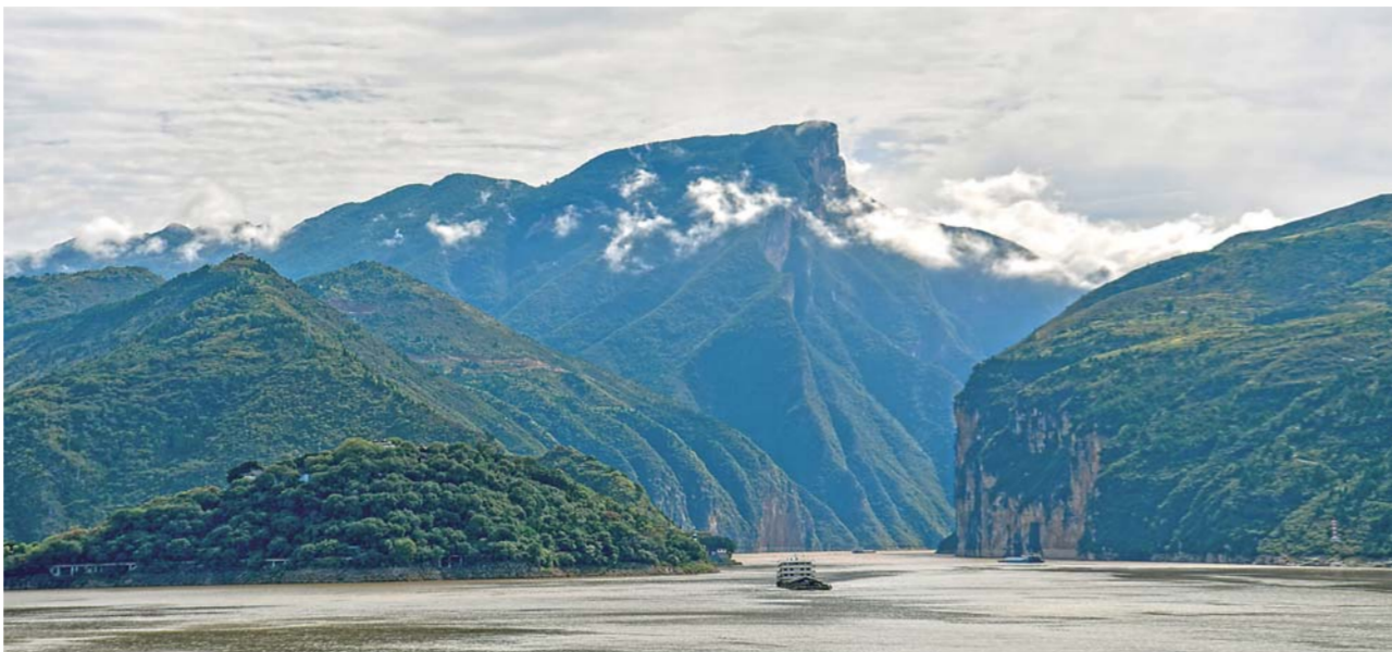
▲长江三峡瞿塘峡峡口的夔门。

“双晒”也在文化旅游业界引发不小的轰动。“重庆的双晒”是品牌营销、经济美学的经典创新范例，形成了强大的聚