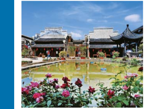
▲俯瞰安义县古村落京台村一角(8月8日无人机拍摄)。 ▲蓝天映衬下的安义古村落(8月8日摄)。