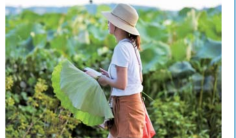
▲游客在江西南昌安义县水南村的荷花田游览(8月8日摄)。 ▼两名手持棒冰的女孩在江西南昌安义县水南赣派小吃街玩耍(8月8日摄)。

2017年8月,当地引进企业对千年古村落进行整体规划建设与运营管理。目前,安义千年古村落已初步建成集赣文化与赣商文化体验、旅游休闲于一体的文化旅游村落。2018年,古村共接待游客近20万人次,村民人均纯收入从2015年的千元左右,提高到2018年底的万元左右,古村焕发新生机,带动了村民增收。