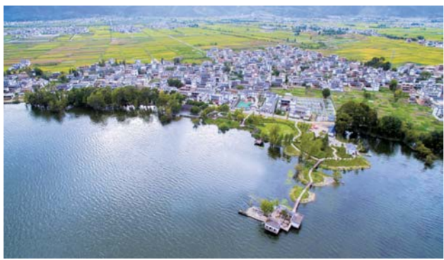
▲云南省大理白族自治州大理市湾桥镇古生村(2017年9月11日摄)。