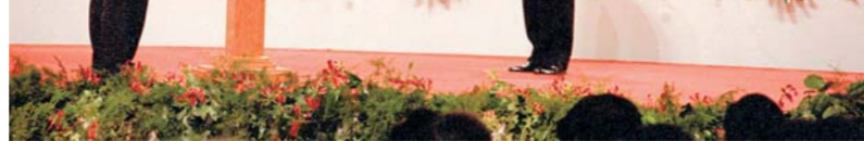
▲ 1997年7月1日凌晨，中华人民共和国香港特别行政区成立暨特区政府宣誓就职仪式在香港会议展览中心新翼七楼隆重举行。香港特区首任行政长官董建华宣誓就职，李鹏同志监誓。

李鹏同志是中国特色社会主义民主法治建设的重要领导者。1998年12月，他担任宪法修改小组组长，主持研究起草宪法修正案草案。经党中央同意，宪法修正案由九届全国人大二次会议通过，以国家根本大法形式确立了邓小平理论的指导思想地位，明确依法治国的基本方略、社会主义初级阶段的基本经济制度和分配制度以及非公有制经济重要作用等内容，对促进我国经济社会发展、推动党和国家沿着中国特色社会主义道路前进具有重大现实意义和深远历史意义。他高度重视立法工作，把加强立法工作、提高立法质量作为全国人大常委会的首要任务，强调立法工作要以宪法为依据，从我国社会主义初级阶段的基本国情出发，服从和服务于国家工作大局。在他的主持下，九届全国人大及其常委会任期内共审议通过法律、行政法规和有关法律问题的决定草案124件，通过113件，包括立法法、合同法、农村土地承包法、证券法、高等教育法等一系列对我国经济社会发展具有重大影响的法律，推动了以宪法为核心的中国特色社会主义法律体系初步形成。他高度重视人大监督工作，加大监督力度，完善监督方式，增强监督实效。九届全国人大及其常委会任期内先后对22件法律和重大问题决定的实施情况进行了检查，听取并审议了国务院、最高人民法院、最高人民检察院的40个专题工作报告，推动宪法、法律实施。他十分重视加强和改进人大代表工作，努力为代表更好履行职责创造条件，认真办理代表议案，把代表工作提高到新水平。他强调要加强人大及其常委会自身建设，改进常委会工作制度，加强常委会工作机构和办事机构建设，深入开展立法和法律实施情况调研，加强法制宣传教育、人大新闻宣传工作和信访工作，联系和指导地方人大开展工作。他积极推动全国人大同外国议会和国际议会组织的交往与合作，促进了中国与有关国家的关系进一步健康稳定发展。（下转6版）