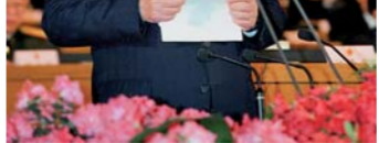
▲ 1998年3月19日，九届全国人大一次会议在北京人民大会堂胜利闭幕。李鹏同志在闭幕会上讲话。