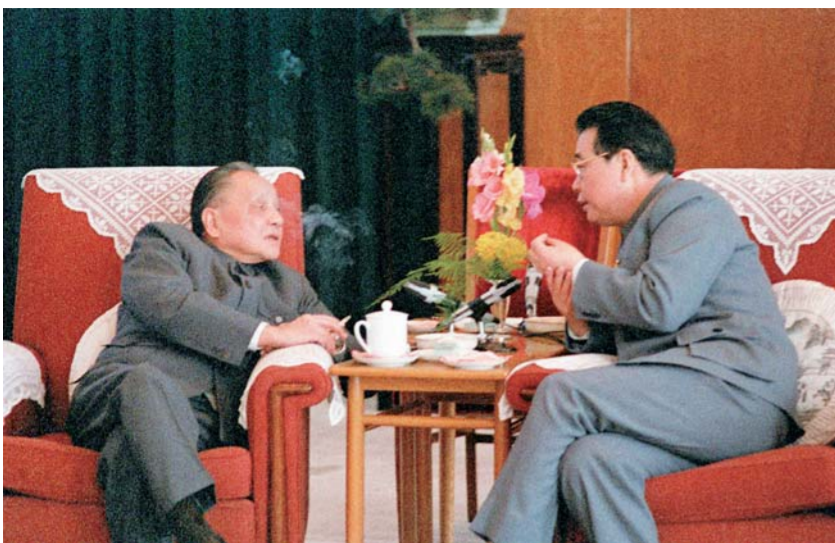
▲ 1988年，邓小平同志与李鹏同志在北京人民大会堂福建厅交谈。 ▶ 2012年11月14日，在党的十八大闭幕前，习近平同志同李鹏同志在一起。