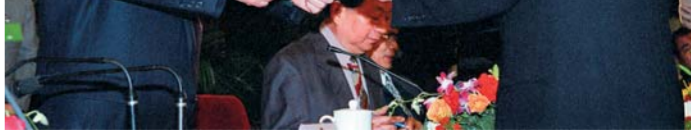
▲ 1998年5月5日，全国人大常委会澳门特别行政区筹备委员会在北京人民大会堂宣告成立并举行第一次全体会议。这是李鹏同志为筹备委员会副主任委员何厚铨颁发任命书。