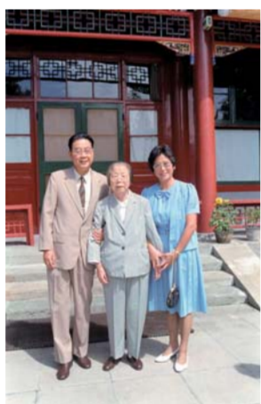
▲ 1959年，李鹏同志在丰满发电厂留影。