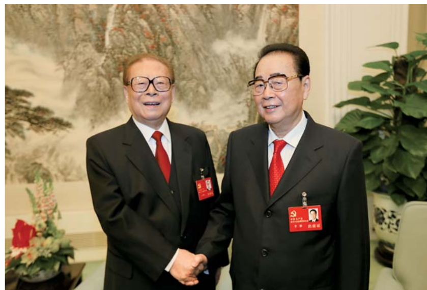
▲ 2012年11月8日，在党的十八大开幕前，江泽民同志同李鹏同志在一起。