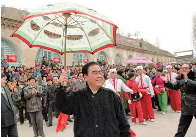
▲ 1996年2月19日至20日，李鹏同志回到阔别50年的延安，看望、慰问延安地区的干部群众，和老区人民一起过年。这是大年初一，李鹏同志同枣园秧歌队一起扭起陕北秧歌。

中国共产党的优秀党员，久经考验的忠诚的共产主义战士，杰出的无产阶级革命家、政治家，党和国家的卓越领导人，中国共产党第十二届中央政治局委员、中央书记处书记，第十三届、十四届、十五届中央政治局常委，国务院原总理，第九届全国人民代表大会常务委员会委员长李鹏同志，因病医治无效，于2019年7月22日23时11分在北京逝世，享年91岁。