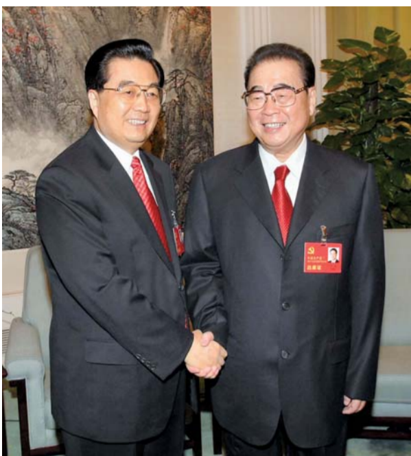
▲ 2007年10月21日，在党的十七大闭幕前，胡锦涛同志同李鹏同志在一起。