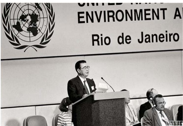
▲ 1992年6月12日，李鹏同志在联合国环境与发展大会首脑会议上发言。