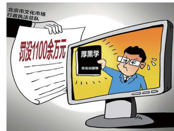
新华社发 郭德鑫作

新华社北京7月10日电(记者张漫子)记者9日从北京市文化市场行政执法总队获悉，北京近期查办了违规发行《厚黑学》图书系列案件，查处涉案公司14家，罚没款共计1100余万元，这是北京市文化市场行政执法总队成立以来在出版物领域罚没款额最高的案件。