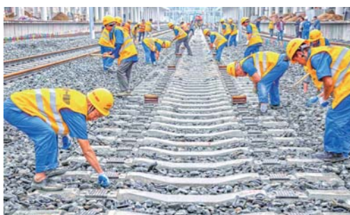
汉十高铁完成铺轨

从2016年开始，新疆尉犁县推进阿克苏沙化土地封禁保护区试点项目，当地居民在沙漠边缘利用草方格固沙，风沙天气逐年减少。