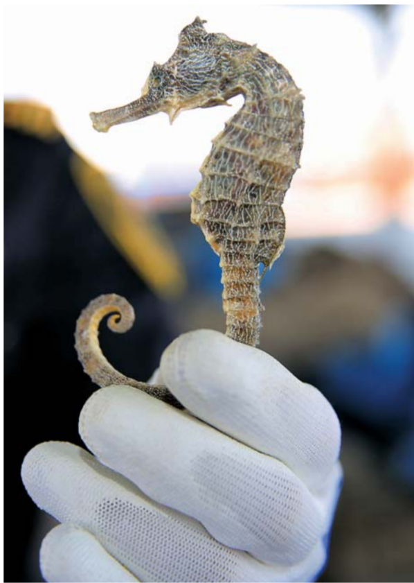
▲青岛海关缉私人员在展示查获的海马干(5月20日摄)。

新华社北京6月17日电(记者刘红霞、魏圣曜)记者17日从海关总署了解到,青岛海关近期破获一起特大濒危物种制品海马干走私案,现场查获1.28吨走私海马干,共计495361尾,抓获2名犯罪嫌疑人。