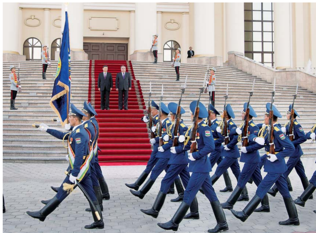
▲会谈前,拉赫蒙在总统府前广场为习近平举行盛大欢迎仪式。

第五次峰会成功举办作出重要贡献,祝贺中华人民共和国成立70周年,祝愿友好的中国永远国泰民安。塔方把深化同中国全面战略伙伴关系作为外交优先方向之一,感谢中方长期以来的支持和帮助,愿在“一带一路”框架内加强双方能源、石化、水电、基础设施建设等领域重点项目合作,助推塔吉克斯坦实现工业化目标。双方要密切青年、教育、文化等人文交流。塔方致力于同中方一道打击“三股势力”和跨国犯罪,加强执法安全合作,密切在上海合作组织、亚信等多边事务中协调。会谈后,两国元首共同出席中方援塔议会大楼、政府办公大楼项目模型揭幕仪式。习近平和拉赫蒙一起参观项目宣传展板,听取有关设计方案、合作情况的介绍,随后前往主席台,一起揭开覆盖在模型上的红绸缎,为模型揭幕。随后,两国元首签署《中华人民共和国和塔吉克斯坦共和国关于进一步深化全面战略伙伴关系的联合声明》,并见证多项双边合作文件的交换。两国元首还共同会见了记者。会谈前,拉赫蒙在总统府前广场为习近平举行了盛大欢迎仪式。丁薛祥、杨洁篪、王毅、何立峰等参加上述活动。