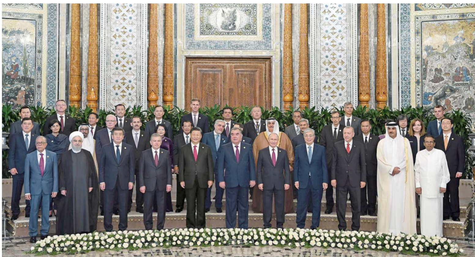
▲6月15日,亚洲相互协作与信任措施会议第五次峰会在塔吉克斯坦首都杜尚别举行。国家主席习近平出席峰会并发表重要讲话。这是出席会议的亚信成员国领导人或代表,观察员国代表以及有关国际和地区组织代表集体合影。

新华社杜尚别6月15日电(记者范伟国、骆璐、郝方甲)亚洲相互协作与信任措施会议第五次峰会15日在塔吉克斯坦首都杜尚别举行。国家主席习近平出席峰会并发表重要讲话,强调要建设互敬互信、安全稳定、发展繁荣、开放包容、合作创新的亚洲。中国将坚定走和平发展道路,坚持开放共赢,坚定践行多边主义,同各方共同创造亚洲和世界的美好未来。