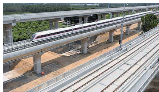
北京新机场线一期试运行

6月15日,北京轨道交通新机场线一期工程开始试运行,计划于2019年9月底随北京大兴国际机场同步开通运营。