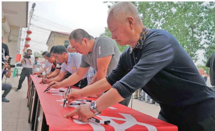
▲5月14日，河北雄安新区容城县八于乡龚庄村村民在支持雄安建设条幅上签名。

新华社石家庄5月14日电（记者王昆、巩志宏）经国务院批准、河北省人民政府审核同意，河北雄安新区容城县人民政府于5月14日发布（2019）第1、2号征收土地和补偿安置方案公告，标志着雄安新区征迁安置工作正式启动。