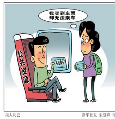
我买到车票却无法乘车

她指出,要深化“放管服”改革,完善配套设施建设补助等政策,鼓励工商资本投资适合产业化经营的农业领域,支持进入乡村生活性服务业。同时要探索在政府引导下工商资本与村集体的合作共赢模式,发展壮大村级集体经济,并通过就业带动、保底分红、股份合作等多种形式,让农民合理分享全产业链增值收益。