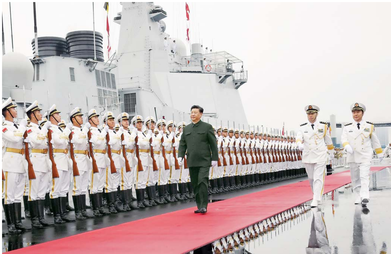
▲4月23日,在中国人民解放军海军70华诞之际,中共中央总书记、国家主席、中央军委主席习近平出席在青岛举行的庆祝人民海军成立70周年海上阅兵活动。图为习近平检阅海军仪仗队。

新华社青岛4月23日电(记者李学勇、李宣良、梅世雄)在中国人民解放军海军70华诞之际,中共中央总书记、国家主席、中央军委主席习近平23日出席在青岛举行的庆祝人民海军成立70周年海上阅兵活动。 青岛春意浓,黄海春潮涌。青岛奥帆中心码头,担负检阅任务的西宁舰按照海军最高礼仪悬挂国旗,五星红旗、八一军旗迎风飘扬。来自61个国家的海军代表团团长