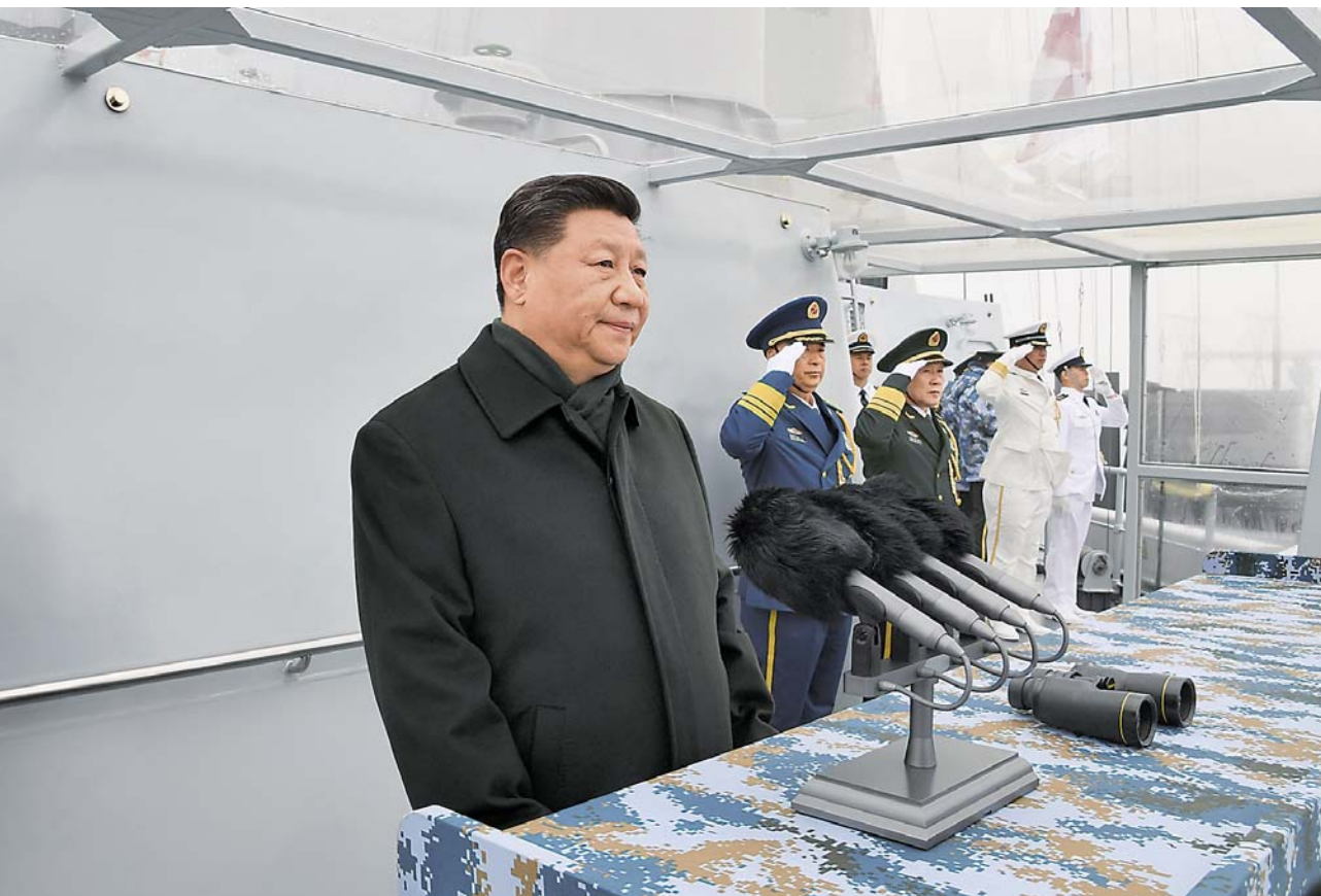
▲4月23日,在中国人民解放军海军70华诞之际,中共中央总书记、国家主席、中央军委主席习近平出席在青岛举行的庆祝人民海军成立70周年海上阅兵活动。图为习近平检阅舰艇编队。