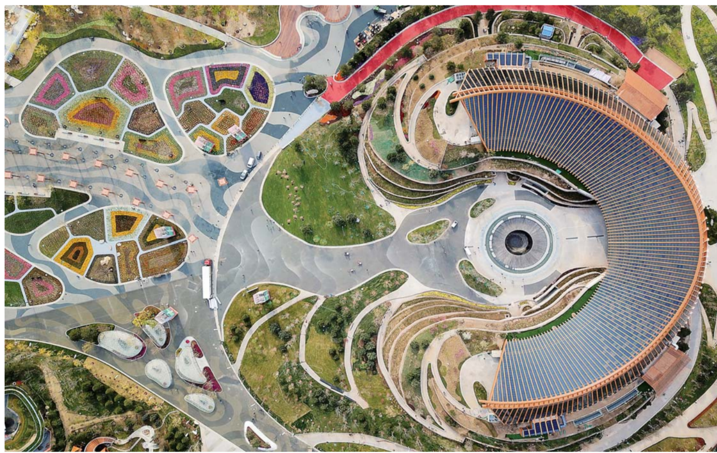
新华社记者骆国骏、李放、魏梦佳、阳娜

璀璨花千树，芳菲四月天。即将在京郊延庆举办的2019年中国北京世界园艺博览会，作为一场人类与自然的精彩对话，一曲创新与绿色的和谐乐章，一个中国与世界的交融平台，正从这里伴着春天的脚步走来。