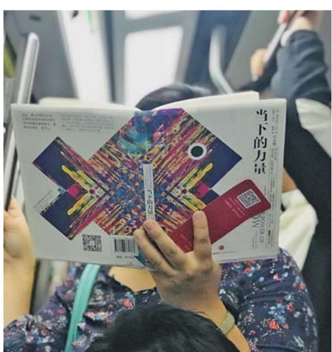
▲ 2018 年 9 月 25 日。临下车前所见。若要减轻焦虑虚无，充满真实感的当下是和平和宁静的入口。