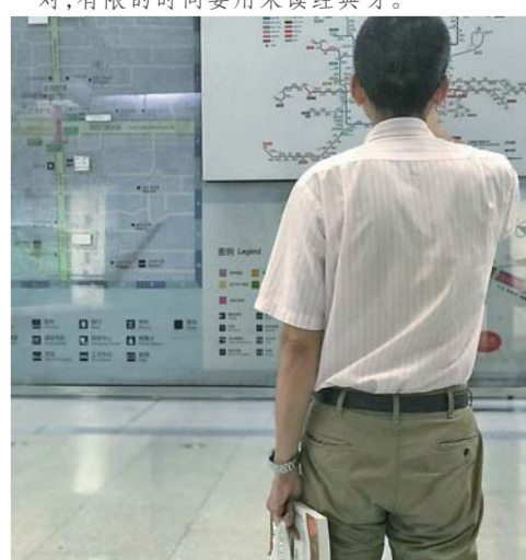
▲ 2018 年 7 月 31 日。他看书太认真，到这一站疑心坐错，从车厢走出来看地铁线路图，看完后又走进车厢。他看的是《从查理大帝到欧元：欧洲的统一梦》。