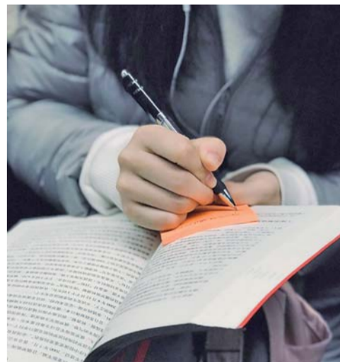
▲ 2018 年 11 月 21 日。很好看的女生，在读《普京传》。她看着看着，从包里掏出便签和笔来，开始记笔记，记完随手把便签贴到了书的封面上。