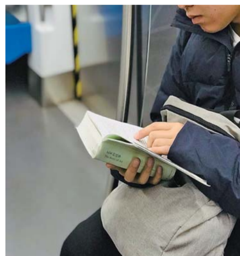
▲ 2018 年 11 月 25 日。竟然有人在周末地铁上读贡布里希《艺术的故事》。也对，有限的时间要用来读经典呀。