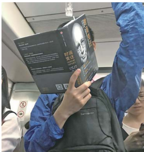
▲ 2018 年 6 月 6 日。满脑子都在想别的，没心思拍照的事。可是他就站在我面前啊，就好像被安排好了。《时运变迁：世界货币、美元地位与人民币的未来》。