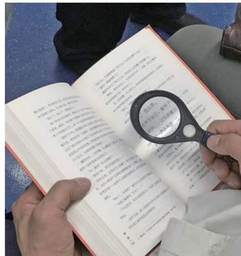
▲ 2018 年 5 月 28 日。当我找出各种理由不读书的时候，他在地铁上拿着放大镜逐字逐句阅读。我也不懂为什么同一天会遇到这么多读书的人，只想说：我爱北京地铁 5 号线。

对不同媒介接触时长来看，成年国民人均每天手机接触时间最长，为 84.87 分钟，互联网接触时长为 65.12 分钟，电子阅读器阅读时长为 10.70 分钟，均有所增长。