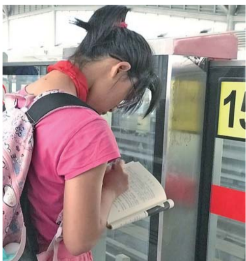
▲ 2018 年 5 月 21 日。等车的红领巾。