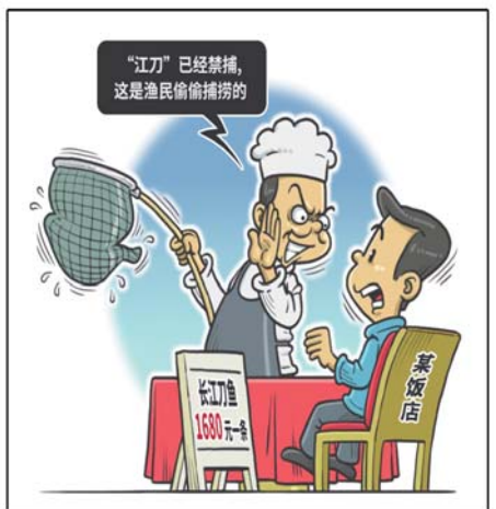
销售噱头 新华社发 程硕 作

据上海市渔政监督管理处介绍,长江渔业管理线(东经122度)西侧的长江水域,严格禁止捕捞。但在管理线东侧的海洋海域,只要是证件齐全的渔船,依然可以合法生产作业。这也就是说,长江的刀鱼是禁捕的,东海的刀鱼则可捕,前者因为肉质鲜美加之禁捕令,价格高出不少。