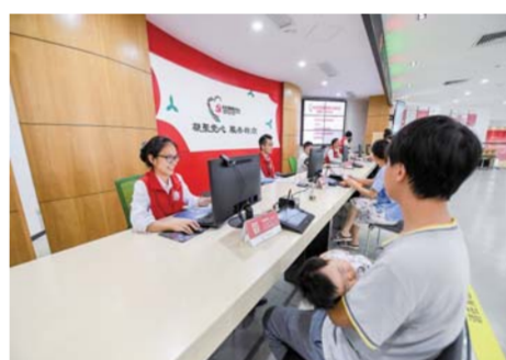
▲在位于深圳龙华区民治街道龙悦居小区四期的北站社区党群服务中心,居民在服务大厅办理业务。(2018年10月24日摄)