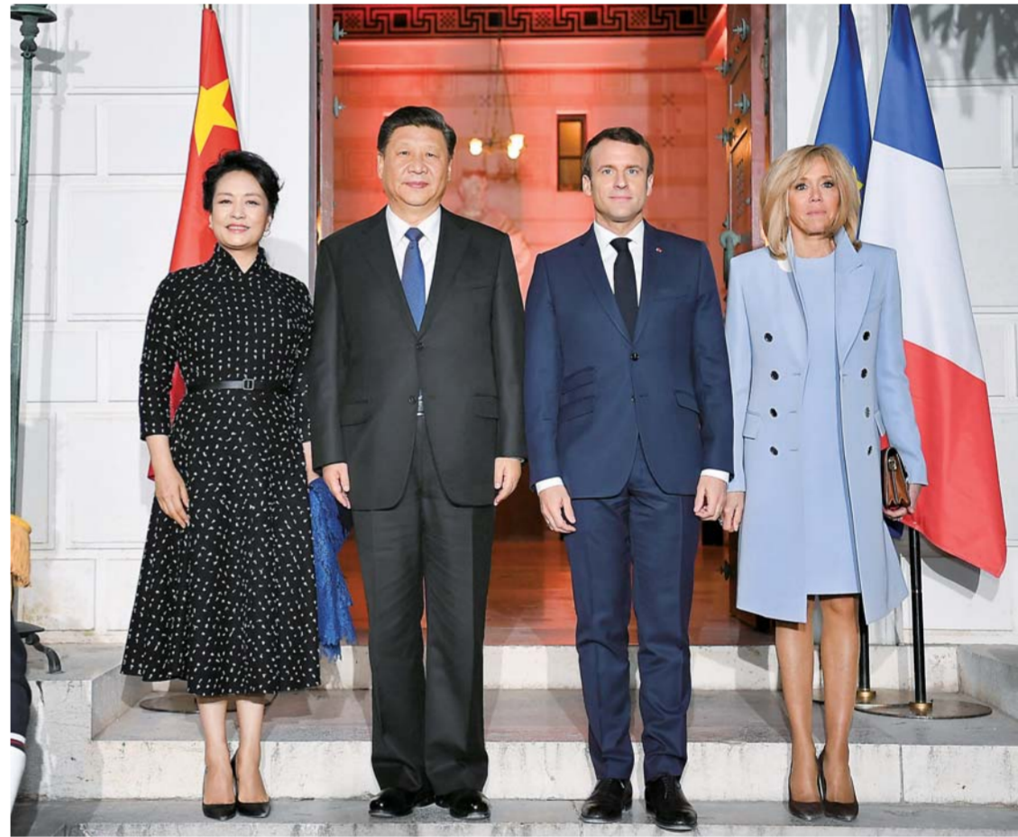
▲3月24日,国家主席习近平在尼斯会见法国总统马克龙。习近平夫人彭丽媛、马克龙夫人布丽吉特参加。

新华社巴黎3月25日电(记者霍小光、李建敏、郝薇)国家主席习近平25日在巴黎爱丽舍宫同法国总统马克龙会谈。两国元首一致同意,承前启后,继往开来,在新的历史起点上打造更加坚实、稳固、富有活力的中法全面战略伙伴关系。 习近平指出,国际形势发生了很大变化,但中法关系始终保持高水平健康稳定发展。总统先生就任以来,两国关系在不到两年时间里又迈上了新台阶,取得很多新成果。今年是一个具有特殊纪念意义的年份,既是中法建交55周年和中国留法勤工俭学运动100周年,也是新中国成立70周年。知古可以鉴今,为了更好前行,当今世界正经历百年未有之大变局,人类处在何去何从的十字路口,中国、法国、欧洲也都处于自身发展关键阶段。中方愿同法方一道,传承历史,开创未来,使紧密持久的中法全面战略伙伴关系继续走在时代前列,共同为建设一个持久和平、普遍安全、共同繁荣、开放包容、清洁美丽的世界作出更多历史性贡献。 习近平强调,要把中法关系发展好,政治互信是关键,务实合作是必由之路,国民感情是基础。新形势下,中法双方在这3个方面做得更好,要继续探索独立自主、相互理解、高瞻远瞩、互利共赢的大国相处之道。政治上,既要筑牢互信的“堤坝”,也要竖立理想的“灯塔”。要深化全方位、多层次、多渠道交流,充分发挥各个机制性对话作用,密切政府、立法机构、政党、军队间交流。要坚持尊重和照顾彼此核心利益和重大关切,和而不同、求同存异。要加强在联合国、二十国集团等多边机制中的合作,密切在气候变化等重大国际问题上的沟通和协调,推动落实《巴黎协定》和联合国2030年可持续发展议程,以实际行动维护以联合国宪章宗旨和原则为基础的国际关系基本准则和多边贸易体制。 习近平指出,在务实合作方面,中法既要深挖市场的“源头活水”,也要疏通政策的“河道沟渠”。双方要深化核能、航空、航天等传统领域合作,加