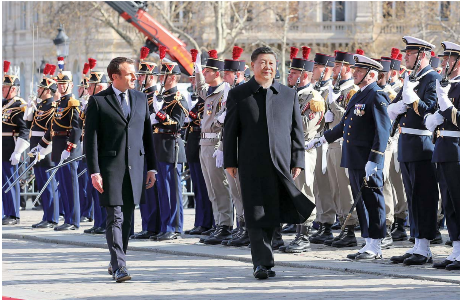
▲3月25日,国家主席习近平在巴黎爱丽舍宫同法国总统马克龙会谈。会谈前,马克龙在凯旋门为习近平举行隆重、盛大的欢迎仪式。