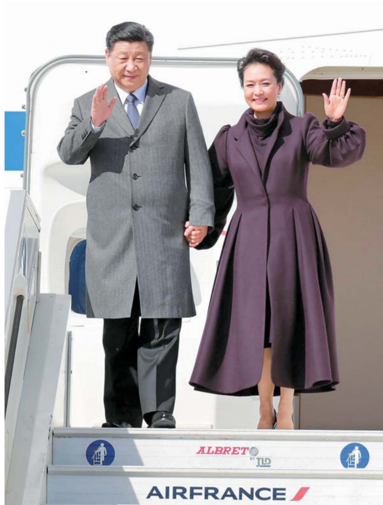
▲3月25日,国家主席习近平在巴黎爱丽舍宫同法国总统马克龙会谈。当日上午,习近平结束在尼斯的行程,乘专机离开尼斯赴巴黎,继续对法国进行国事访问。这是习近平和夫人彭丽媛抵达巴黎戴高乐机场。