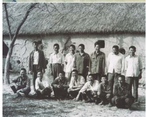
▶安徽凤阳县小岗村几名农民展示领到的《农村土地承包经营权证》(2015年7月8日摄)。