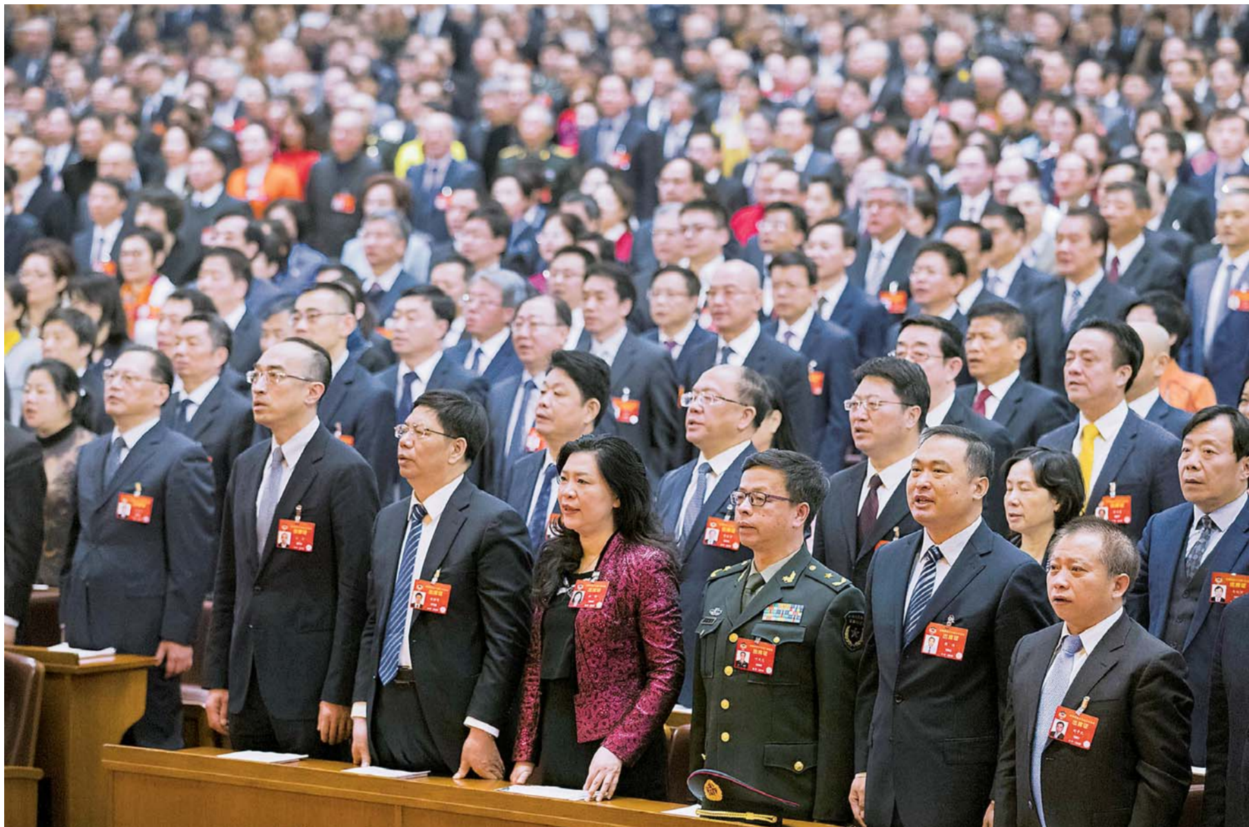
委员们高唱国歌。三月十三日，中国人民政治协商会议第十三届全国委员会第二次会议在北京人民大会堂闭幕。