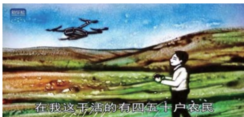
在我这干活的有四五十户农民