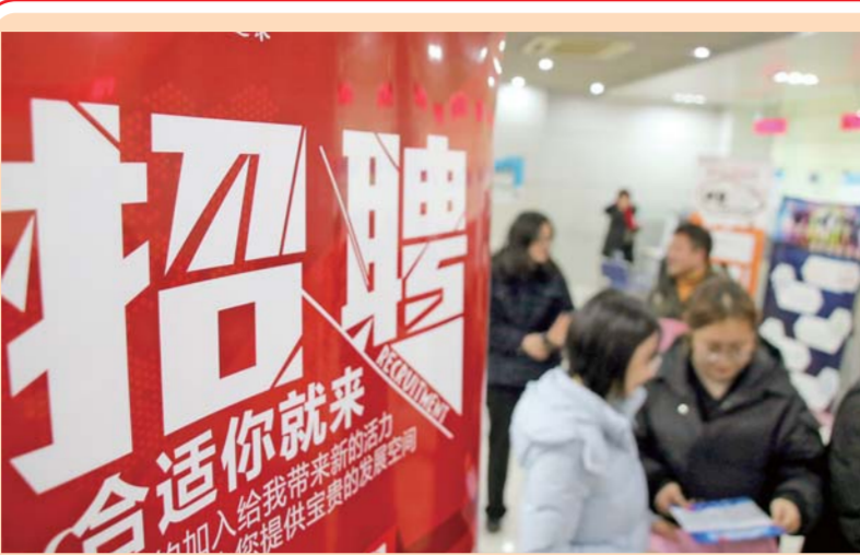
▲在江苏省苏州市“春风行动”综合招聘会上，求职者在了解招聘信息(2月15日摄)。