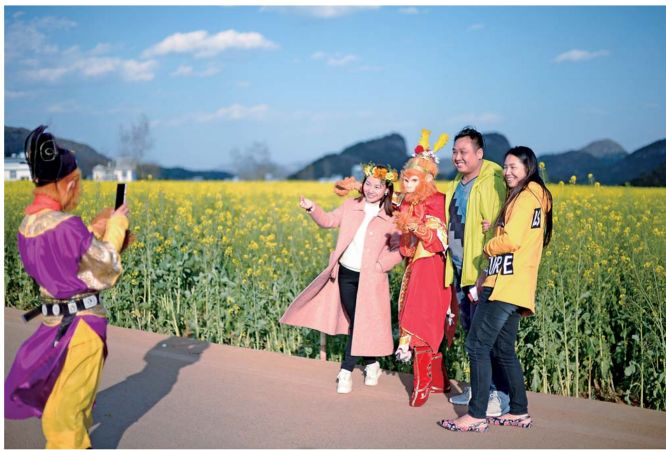
▲2月19日,云南省曲靖市罗平县百万亩油菜花竞相绽放,游客在拍照留念。