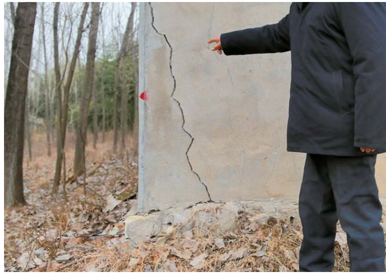
▲山东省临沂市兰陵县兰陵镇金山村村民指出自家房屋的裂缝(1月5日摄)。

米的新房,在刚盖好一年后,从大门到屋顶被震出裂缝,院墙也被震裂。她说:“住在家里担惊受怕。”一位70岁的村民指着山脚下的房子说:“夜里一声巨响,我家的土坯老房就塌了,新房的两处墙角被震出一两米高、一指宽的裂缝,我和老伴赶紧往外跑,以为是地震了。”