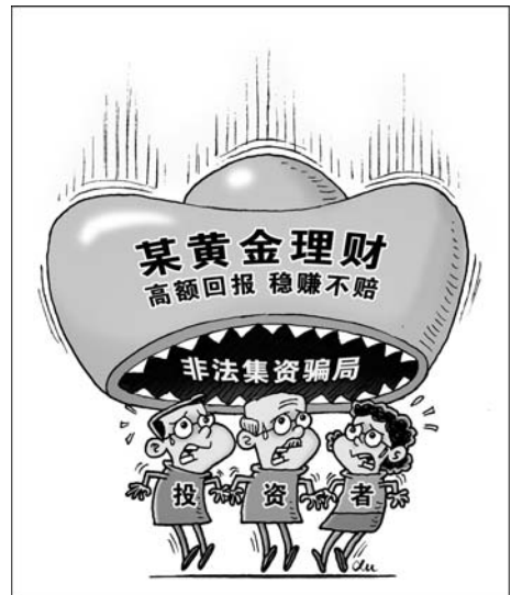
“金玉其外” 新华社发 徐骏 作

门,投资者很容易被高息诱惑。而且,公司还打着“响应各项发展政策”“发展经济”“顺应理财新趋势”等旗号,给投资人一种值得信赖的假象。