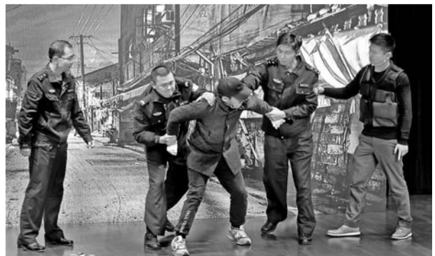
▲12月12日，上海市公安局闵行分局民警表演小品《你是我的眼》

当日，上海市闵行区政法委等单位共同举办“向公正权威高效全面迈进——闵行区司法改革巡礼”主题活动。活动中闵行区政法系统各单位以演讲、小品、情景剧等形式，集中展示了司法改革以来取得的丰硕成果及多项司法改革措施的成功实践。