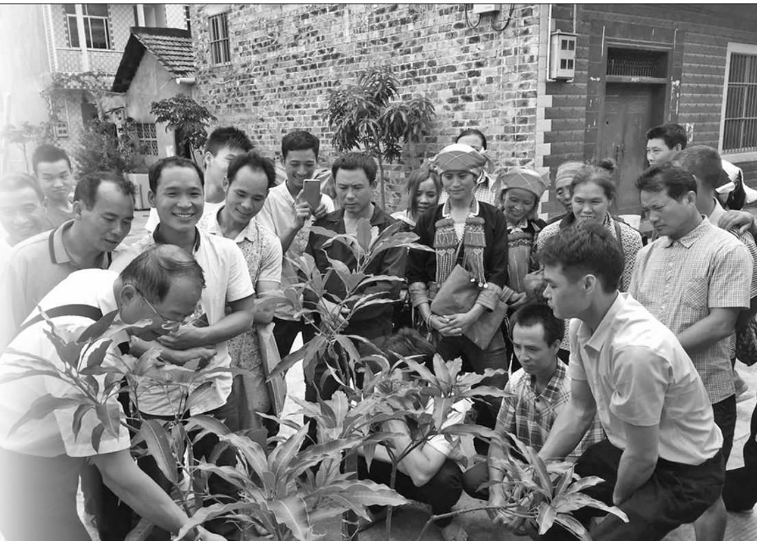
农业技术人员深入田间地头开展扶贫教育培训

才担任兼职教师共78名,组建了壮语培训队、科级领导培训队、贫困村党组织“第一书记”培训队、驻村工作队员培训队、村干部培训队等5支培训队共42人,深入贫困村屯,通过壮戏、快板、讲座等形式,举办100场“板凳圈”“乡村夜话”“乡村夜校”等系列培训,完成贫困村党支部书记、农村党员致富带头人、村信息员等专题培训班12期1072人次。通过全覆盖培训活动,干部帮扶能力、“双带能力”得到提升。 文/甘天龙