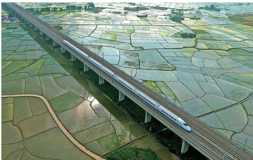
▲动车在广西宾阳县的田野上行驶（2017年4月16日摄）。

展“等不起、慢不得、坐不住”。加快贫困地区脱贫致富奔小康，是广西全面建成小康社会必须啃下的硬骨头。