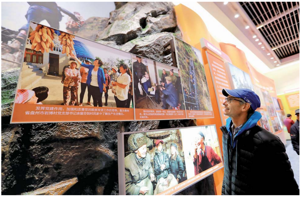
▲12月6日,一名来自以色列的参观者在展览大厅内观看展出的图片。截至当日,在中国国家博物馆举行的“伟大的变革——庆祝改革开放40周年大型展览”累计参观人数突破100万。

——这是万千活力汇聚而成的时代伟力,一个“人”字带来自觉创新的不懈动力。(下转2版)