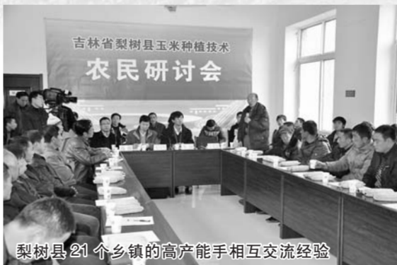
梨树县21个乡镇的高产能手相互交流经验

2016年,在海南举行的首届中国农业(博鳌)论坛上,以“肥沃黑土、优质绿色”为主题的梨树黑土地分论坛格外引人注目。论坛期间,梨树县发布了《非镰刀弯地区“梨树模式”绿皮书》,开展了多场专家讲座和对话交流活动。为不断扩大“梨树模式”的推广范围,通过举办梨树黑