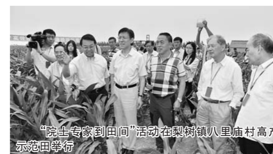
“院士专家到田间”活动在梨树镇八里庙村高产示范田举行