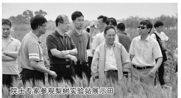
院士专家参观梨树实验站示范田

通过持续举办黑土地论坛,梨树农业创新步伐明显加快。“农民持续致富、县域经济强势崛起和率先实现农业现代化的目标,正向梨树县走来。