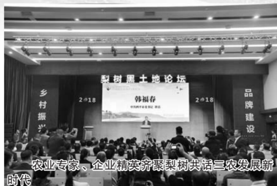
农业专家、企业精英齐聚梨树共话三农发展新

通过几年来的跟踪测产,梨树县采用免耕秸秆覆盖技术,既节省劳动力,又减少化肥等农资的投入,每公顷可节约成本1200元—1500元,单产提高10%左右。