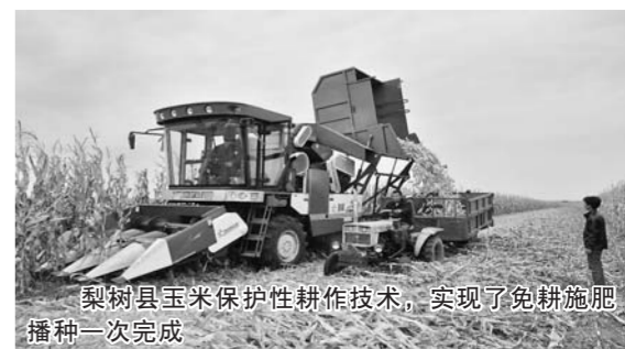
梨树县玉米保护性耕作技术,实现了免耕施肥播种一次完成