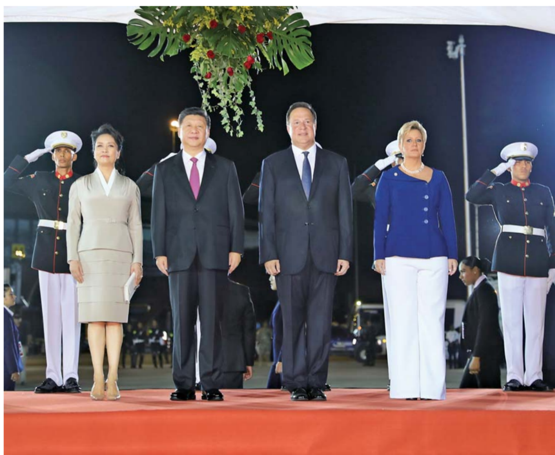
▲当地时间12月2日,巴拿马总统巴雷拉在机场为习近平举行隆重欢迎仪式。这是习近平和夫人彭丽媛同巴雷拉和夫人卡斯蒂略在欢迎仪式上。