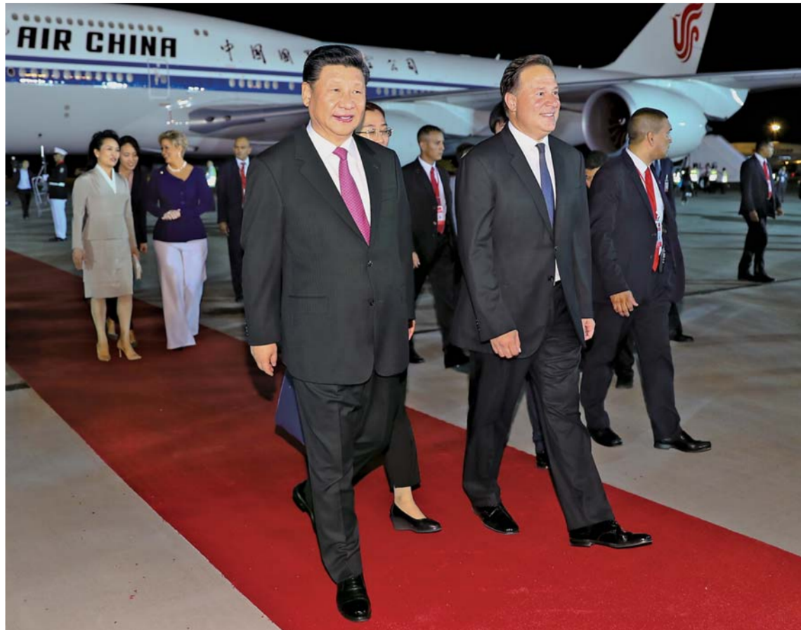
▲当地时间12月2日,国家主席习近平抵达巴拿马城,开始对巴拿马共和国进行国事访问。巴拿马总统巴雷拉和夫人卡斯蒂略在舷梯旁热情迎接习近平和夫人彭丽媛。

当地时间20时,习近平乘坐的专机抵达巴拿马城国际机场。习近平和夫人彭丽媛步出舱门,巴拿马总统巴雷拉和夫人卡斯蒂略在舷梯旁热情迎接。两国元首夫妇亲切握手,互致问候。礼兵肃立在红地毯两侧。(下转2版)