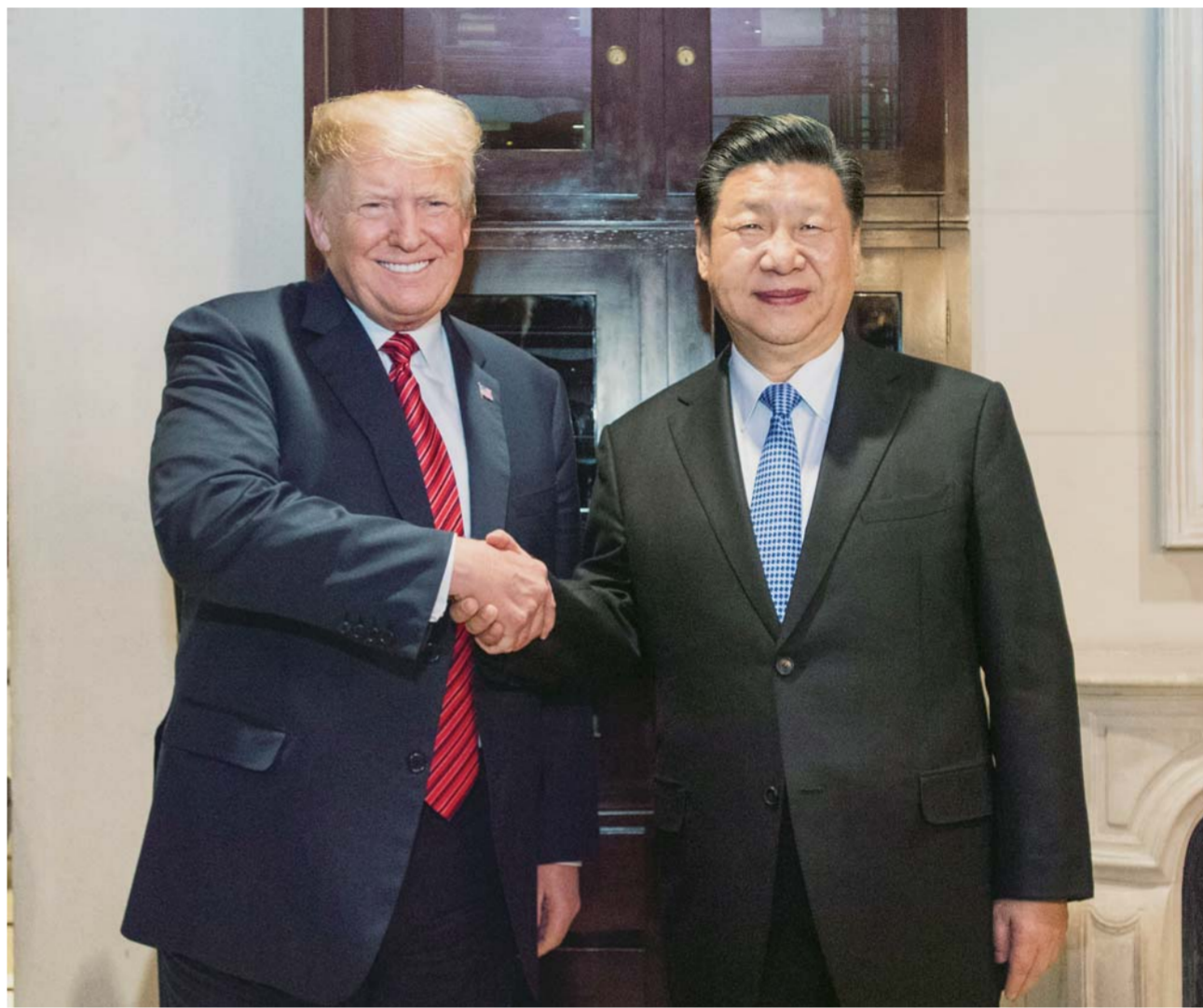
▲当地时间12月1日，国家主席习近平应邀同美国总统特朗普在阿根廷布宜诺斯艾利斯共进晚餐，举行会晤。

新华社布宜诺斯艾利斯12月1日电(记者霍小光、骆璐、黄尹甲子)当地时间12月1日晚，国家主席习近平应邀同美国总统特朗普在布宜诺斯艾利斯共进晚餐并举行会晤。两国元首在坦诚、友好的气氛中，就中美关系和共同关心的国际问题深入交换意见，达成重要共识。双方同意，在互惠互利基础上拓展合作，在相互尊重基础上管控分歧，共同推进以协调、合作、稳定为基调的中美关系。