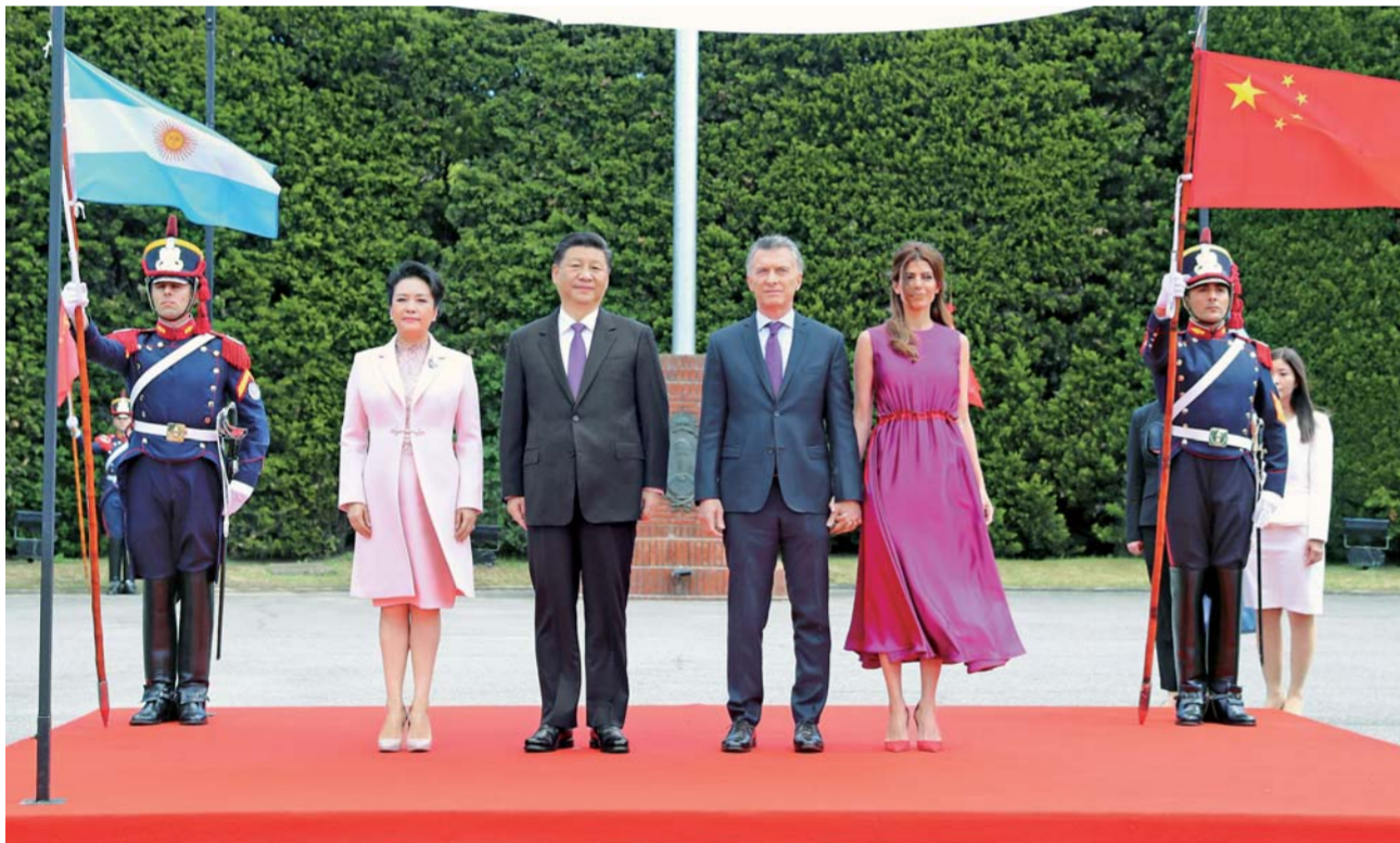
▲当地时间12月2日，国家主席习近平同阿根廷总统马克里在布宜诺斯艾利斯举行会谈。会谈前，马克里在总统官邸荣誉广场为习近平举行隆重欢迎仪式。这是习近平和夫人彭丽媛同马克里和夫人阿瓦达在欢迎仪式上。