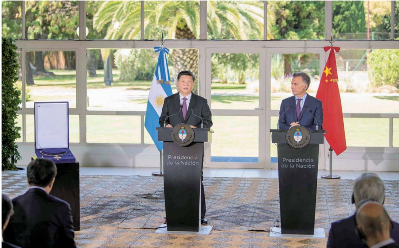
▲当地时间12月2日，国家主席习近平在布宜诺斯艾利斯接受阿根廷总统马克里授予的“解放者圣马丁大项链级勋章”。

新华社布宜诺斯艾利斯12月2日电(记者陈贻、霍小光、王海清)当地时间12月2日，国家主席习近平同阿根廷总统马克里在布宜诺斯艾利斯举行会谈。两国元首一致同意，以更加广阔视野谋划两国关系发展蓝图，携手开创中阿全面战略伙伴关系新时代。