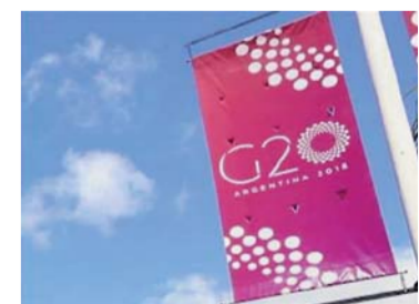
扫描二维码，看新华社微视频产品《第1视点》习主席 G20 高光时刻。