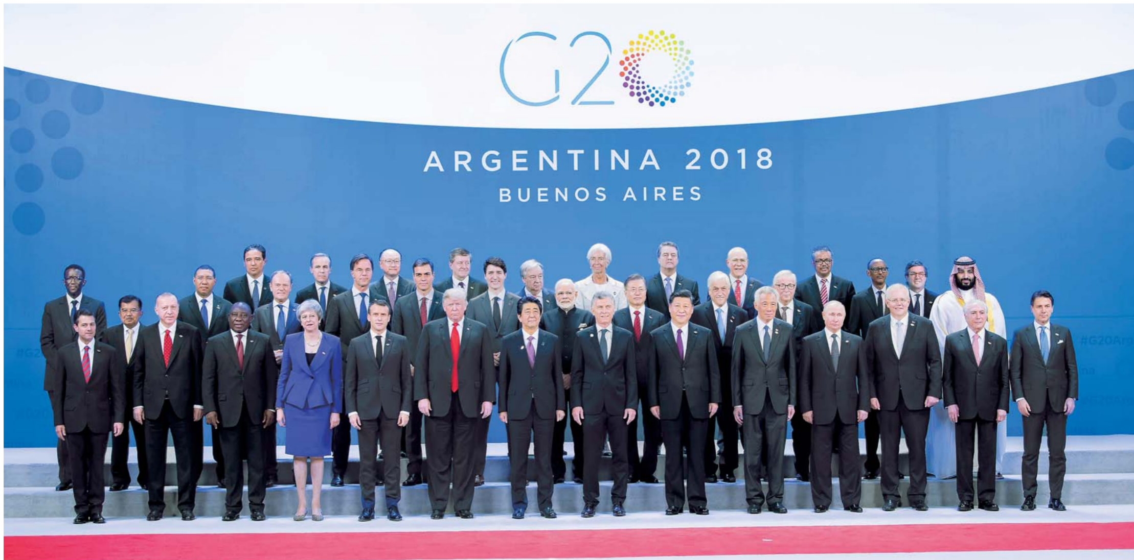
▲当地时间11月30日，二十国集团领导人第十三次峰会在阿根廷布宜诺斯艾利斯举行。这是国家主席习近平同其他与会领导人合影。