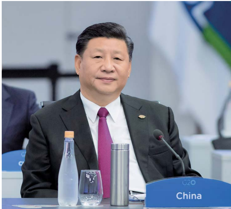
▲当地时间11月30日，二十国集团领导人第十三次峰会在阿根廷布宜诺斯艾利斯举行。国家主席习近平出席第一阶段会议并发表题为《登高望远，牢牢把握世界经济正确方向》的重要讲话。

强调要坚持开放合作、伙伴精神、创新引领、普惠共赢，以负责任态度把握世界经济大方向