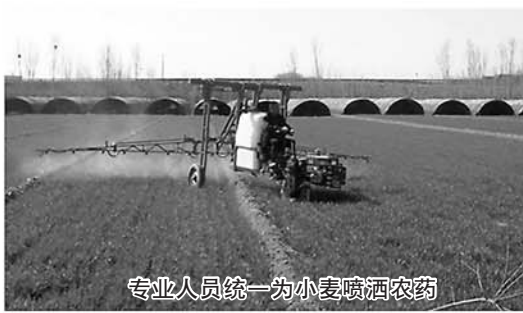
专业人员统一为小麦喷洒农药