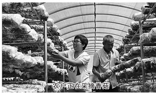
农户正在采摘香菇