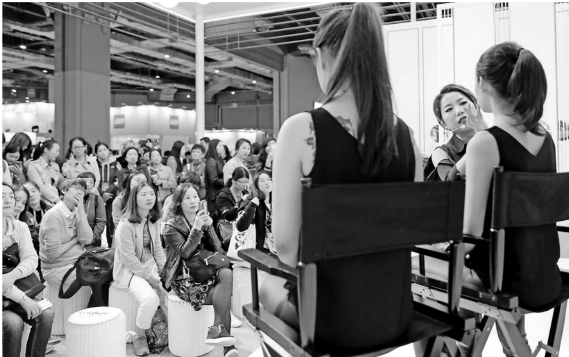
▲观众在首届进博会上一家化妆品展台学习彩妆技法(11月8日摄)。

新华社上海11月15日电(记者何欣荣、刘红霞、周蕊)11月10日,首届中国国际进口博览会圆满收官。11日,天猫“双11”活动迎来十周年。