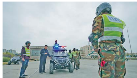
非洲警察北京学警务驾驶

11月15日,由公安部主办的2018年埃塞俄比亚警察培训班上,来自埃塞俄比亚的30余位警察进行警务驾驶等项目的训练。