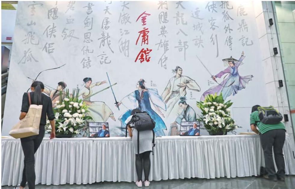
▲11月12日,读者在“金庸馆”吊唁。

下午3时,已有超过100人在“金庸馆”外排队等候入场,陆续仍有不少读者前来,队伍越来越长。4时左右,这条队伍已经沿着香港文化