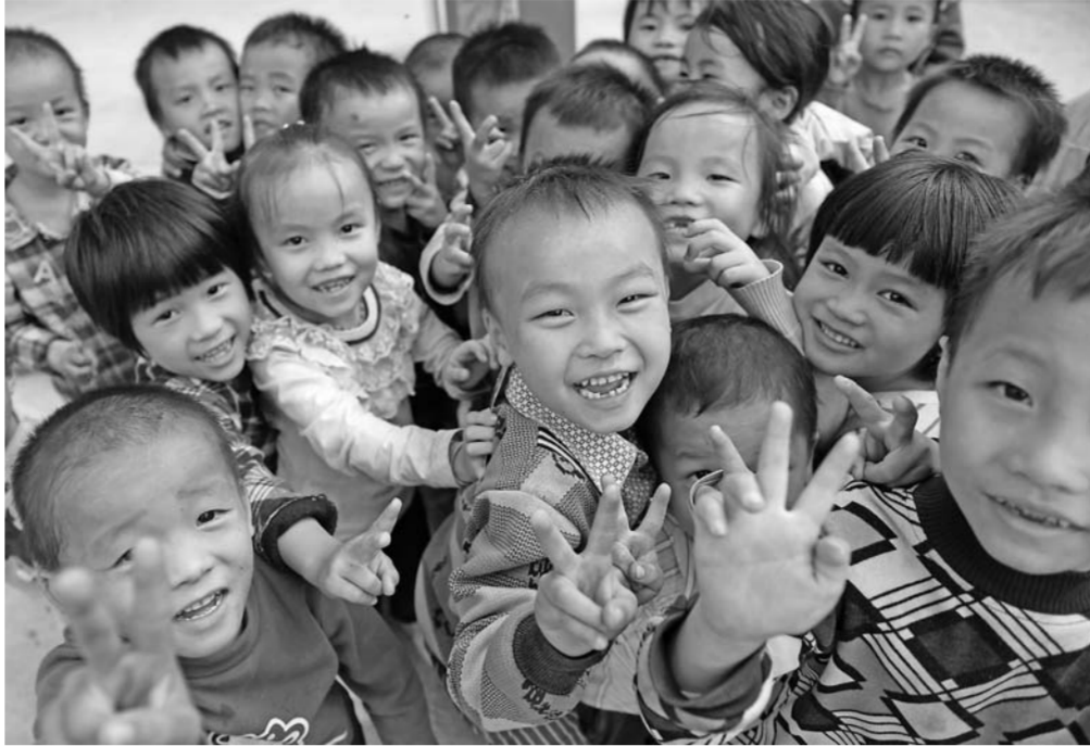
▲广西都安瑶族自治县东庙乡三团小学学生在课间一起玩耍（11月6日摄）。