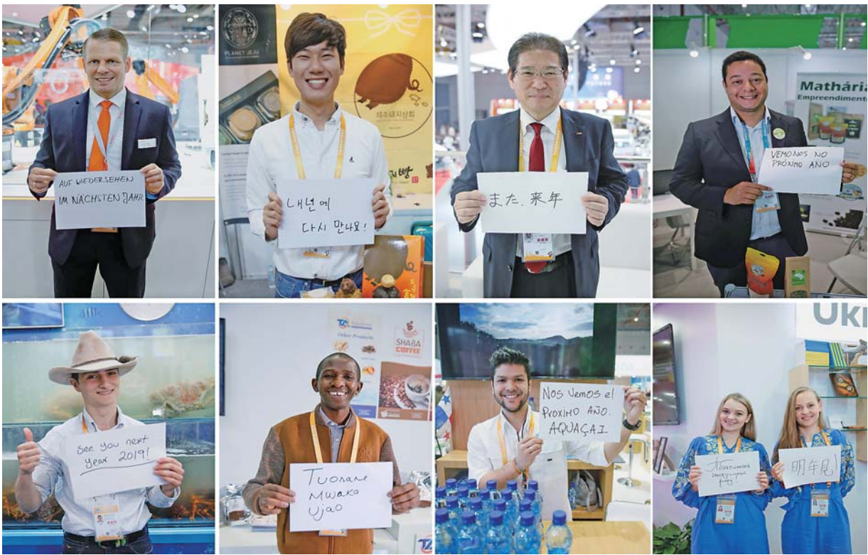
▲11月10日,进博会上不同国家的参展人员展示用不同语言书写的“明年见”(拼版照片)。