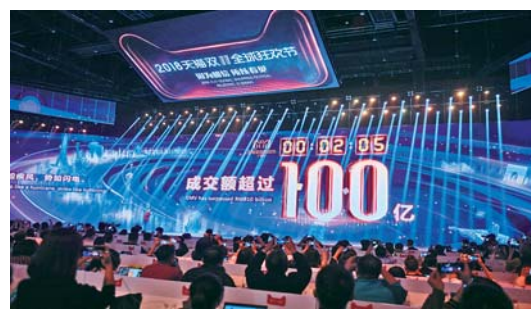
天猫“双11”约两分钟成交额破百亿

11月11日,在上海举行的2018天猫“双11”晚会上,大屏显示仅用了2分05秒阿里巴巴平台上的成交额就冲破100亿元。