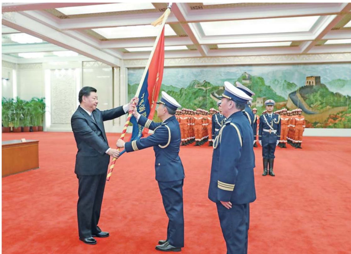
▲11月9日，国家综合性消防救援队伍授旗仪式在人民大会堂举行。中共中央总书记、国家主席、中央军委主席习近平向国家综合性消防救援队伍授旗并致训词。这是习近平致训词。