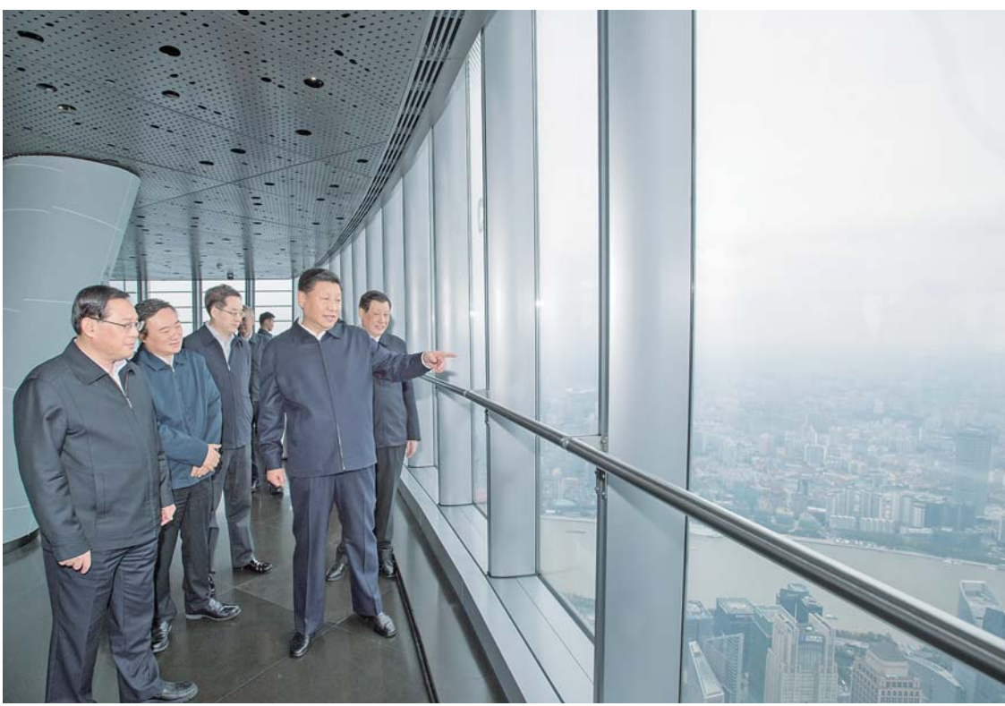
▲6日上午，习近平在上海中心大厦119层观光厅俯瞰上海城市风貌。

考察期间，习近平在上海亲切接见驻沪部队副师职以上领导干部和团级单位主官，代表党中央和中央军委向驻沪部队全体官兵致以诚挚问候。张又侠陪同接见。 丁薛祥、刘鹤、何立峰和中央有关部门负责同志陪同考察。