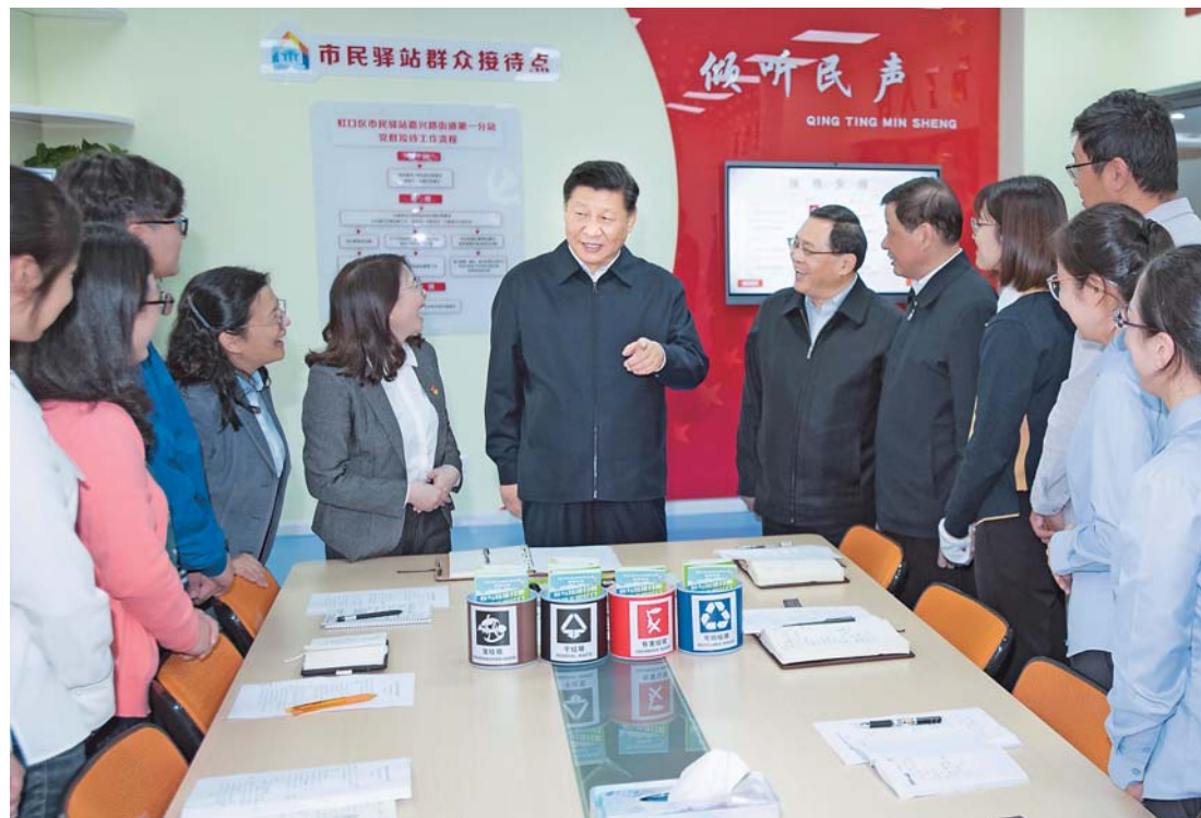
▲6日上午，习近平在虹口区市民驿站嘉兴路街道第一分站，同几位正在交流社区推广垃圾分类的年轻人的年轻人亲切交谈。