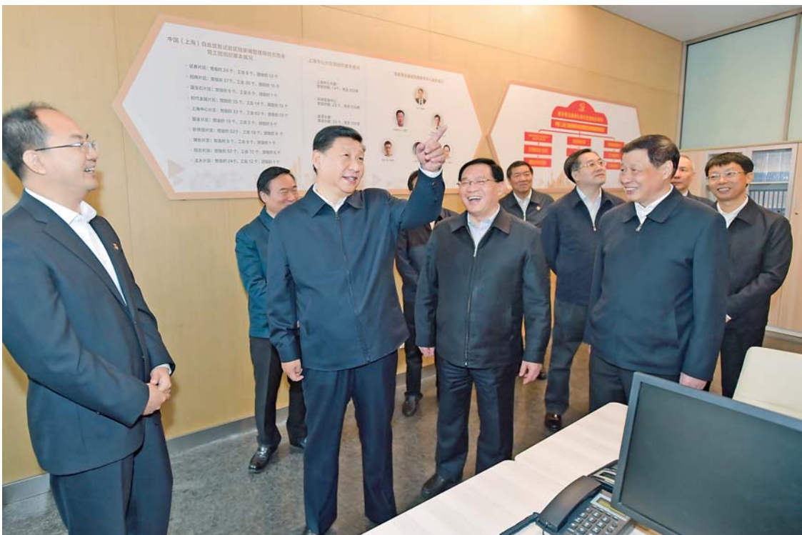
▲6日上午，习近平在上海中心大厦22层的陆家嘴金融城党建服务中心，详细了解中心开展党建工作等情况。