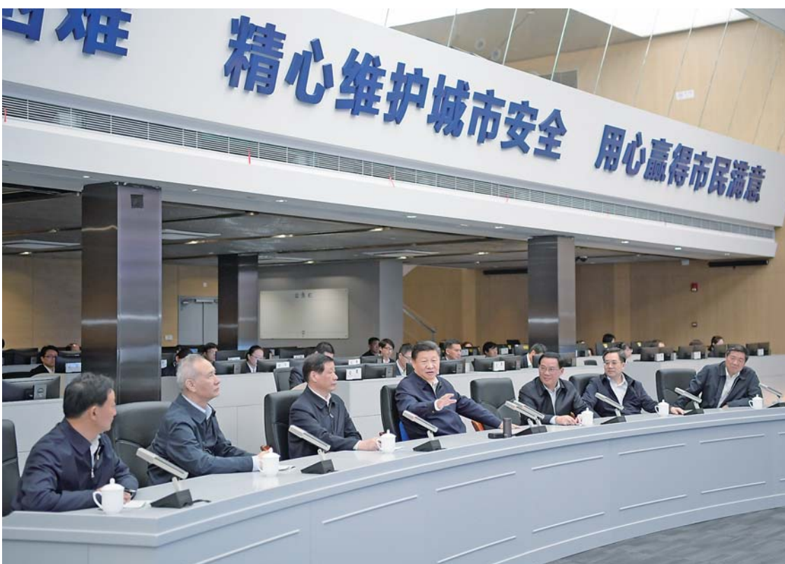
▲6日下午，习近平在浦东新区城市运行综合管理中心了解上海城市精细化管理和国际贸易单一窗口运营情况。