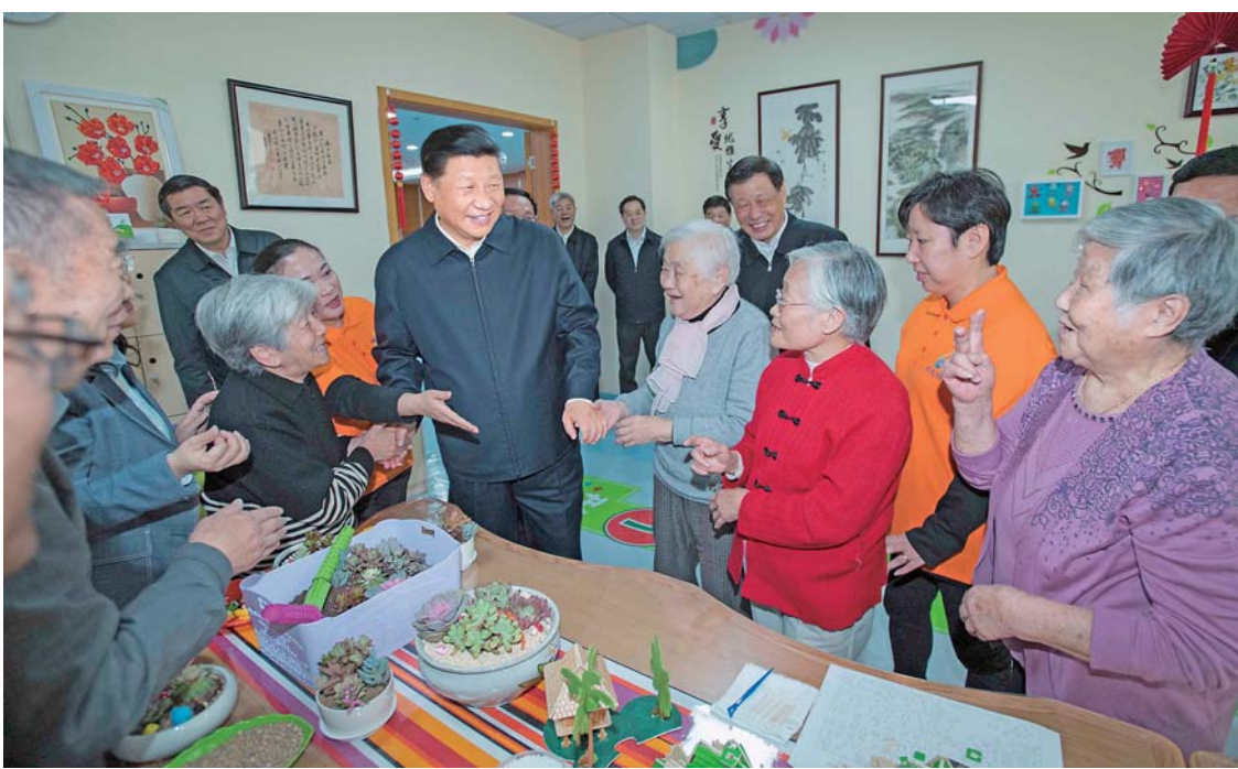
▲6日上午，习近平在虹口区市民驿站嘉兴路街道第一分站托老所同老年居民亲切交谈。