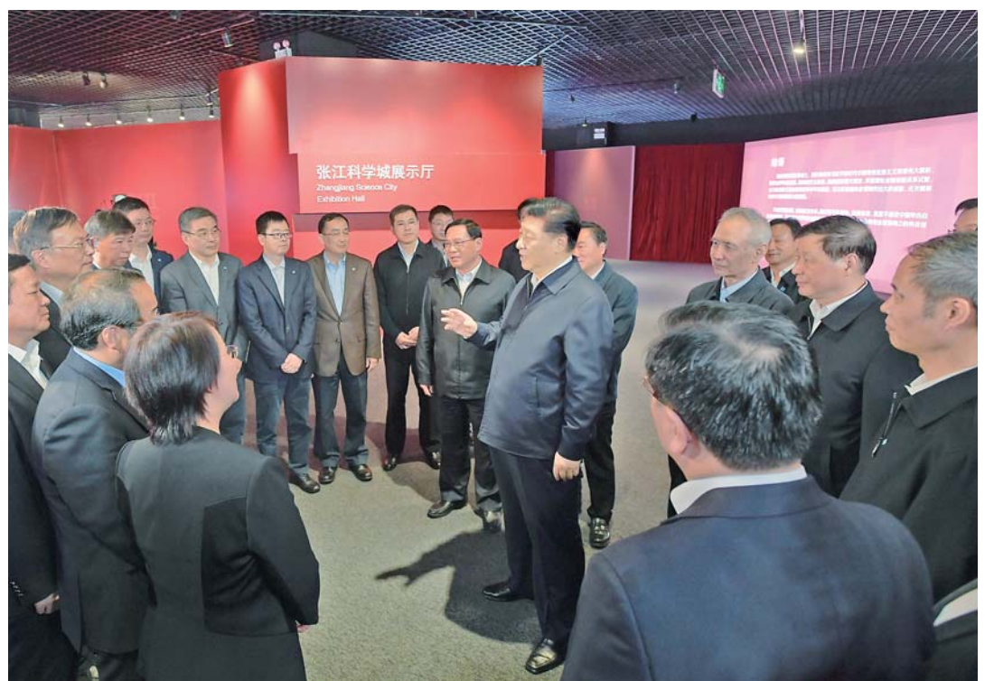
▲6日下午，习近平在张江科学城展示厅考察时，同在场的科技工作者亲切交谈。