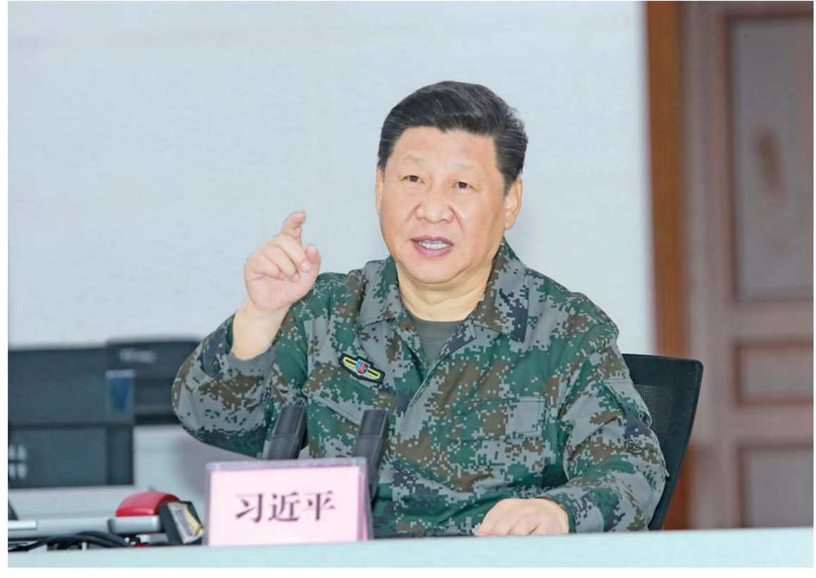
▲10月25日上午,中共中央总书记、国家主席、中央军委主席习近平到南部战区视察调研。这是习近平视察指挥大厅,实地了解战区联合作战指挥体系构建运行情况,勉励战区发扬改革创新精神,持续深化实践探索,加快把指挥能力搞过硬。