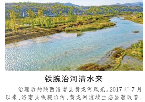
铁腕治河清水来 治理后的陕西洛南县黄河风光。2017年7月 以来,洛南县铁腕治河,黄龙河流域生态显著改善, 河道中再现鸥鹭成群景象。