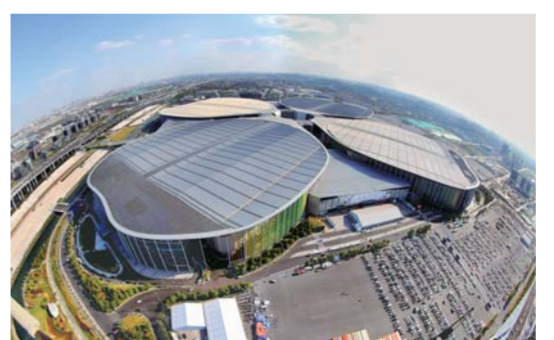
▲这是中国国际进口博览会举办场地——国家会展中心(上海)。

安慰了康希们“思乡胃”的“全球味”,得益于贸易便利化和海关机构改革释放的效能——来自新西兰的牛奶周一挤奶,周三就能送到消费者的餐桌;来自加拿大的海鲜36小时内就能“直达”上海。海外