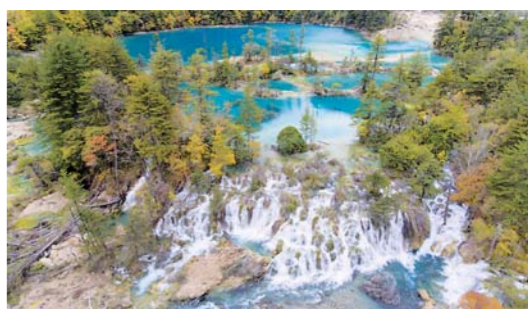
九寨沟：生态修复孕美景

这是修复后的九寨沟火花海决堤后下游一角。九寨沟地震造成个别景点不同程度受损。目前，景区正加紧恢复重建。