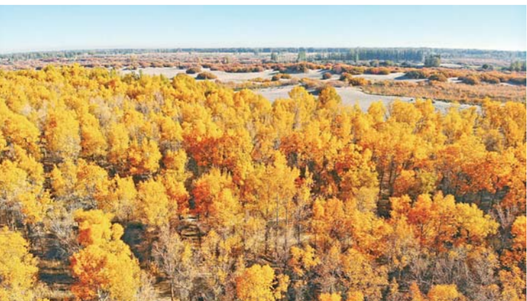
俯瞰金塔沙漠胡杨林景区(10月10日无人机拍摄)