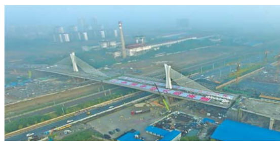
邢台耸起地标性立交桥

10月16日,河北省邢台市莲池大街上跨京广铁路塔楼斜拉索桥10号、11号主桥成功转体。该立交桥是邢台市地标性建筑。